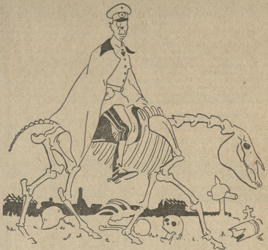
General Seeckt — niemiecki bóg wojny.

Stany Zjednoczone A. P. mają 565.000 żołnierzy. Armia czynna liczy 157.000, z czego w kraju 100.000 w kolonjach 39.000,