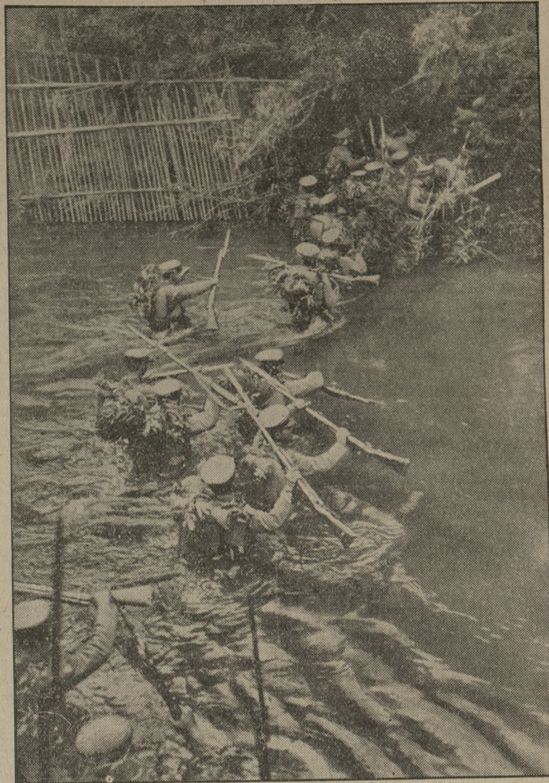
Do konfliktu istniejącego obecnie między Chinami a Japonją. Wojsko chińskie przeprawiające się wpraw przez rzeczkę.

Ciało swoje ogrzewamy za pomocą żywności, która spala się w nas w drodze