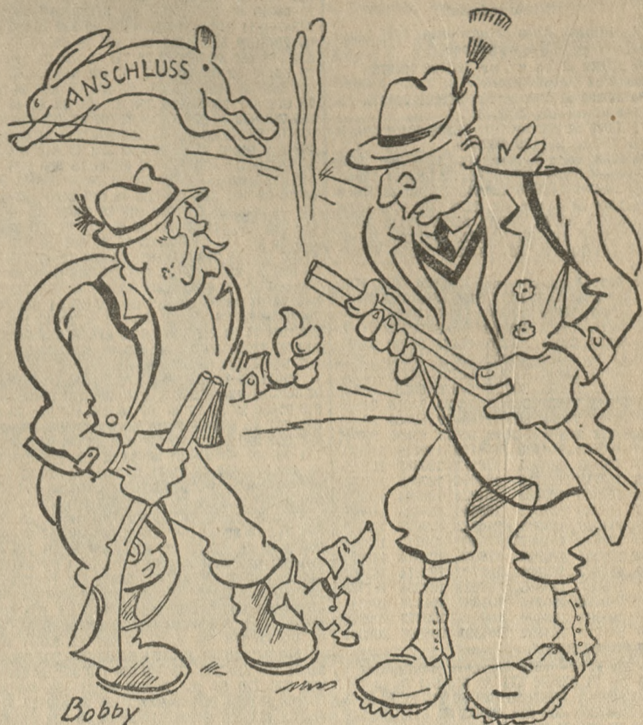
Schober do Curtiusa: Herr Kollege, tego zajęcia fatalnie spudlowaliście.