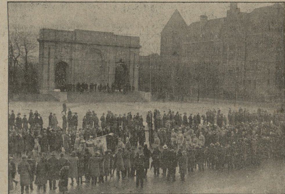
Fragment pochodu, urządzanego przez Legion Wielkopolski, na tle zamku i Pomnika Wdzięczności.

dzie. W sukniach wieczorowych i balowych usiłował narzucić nam starość, eczynę — powrót do tiunriury i tysiące falbanek. Zdrowy rozsądny wybrzyk ten odrzucił, modernizując go wprowadzeniem sutojszych fald i kloszów z tyłu pod bardzo głębokim dekoltem. Monotonję czarnych sukien z czarnymi bolerkami które od paru lat były czemś w rodzaju munduru, tak dalece były rozpowszechnione, ożywiła moda wprowadzeniem bolerek kolorowych, jaskrawych, połyskujących załamaniem welurów, z rękawkami do łokcia, suto obłożonym futrem. I tu — jaknajdalej idąca fantazja. Zakieciaki skromniejsze zdobi tylko pasek futrzany, zakieciaki bardziej strojne, sortles balowe, mają szerokie mankiety od łokcia do kostki, sobolowe lub gronostajowe. Idąc jeszcze dalej — zakieciaki całe z gronostajów, pasujące do sukni każdego koloru.