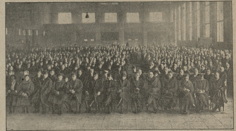
Wielka hala reprezentacyjna P. W. K. była wypełniona publicznością po brzegi.