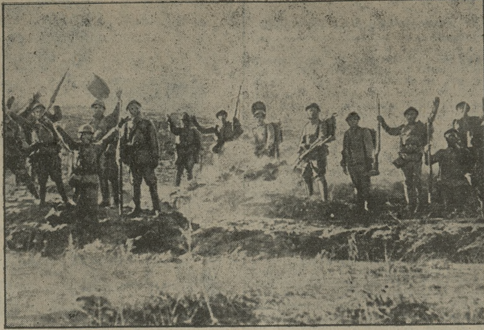
Z terenu walk w Mandzurji. — Oddział wojska japońskiego, wyrażający po zdobyciu pewnej pozycji swą radość wymachiwaniem rąk i okrzykami.

kogucia — 1. Bayer (Sz.), 2. Grządzielski (H), 3. Szumiński (H); piórkowa — 1. Smół (H), 2. Grodzki (Szt.), 3. Rubach (Szt.); lekka — 1. Oleśniczak (Zb.), 2. Zaporowski (Sw.), 3. Gorzeń (Zb.); półśrednia — 1. Tuszyński (H), 2. Lewandowski (Szt.), 3. Zajackowski (Zb.); średnia — 1. Szajek (Szt.), 2. Gaśowski (Zb.), 3. Spychała (H); półciężka — 1. Łukasiewicz (Szt.), 2. Elsner (H), 3. Lewandowski (S); ciężka — 1. Grajewski (S), 2. Kałek (H), 3. Guenter (Zb.). Ogółem walczyło 60 zapasników. Sędziował p. Ryfa. Drużynowo: 1. Szteker i HCP po 14 p., 3. Zbyszko 8 p., 4. Sokół 4 p., 5. Stow. Sp. Swarzędz 2 p. (wz)