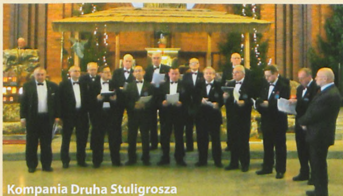
Kompania Druha Stuligrosza