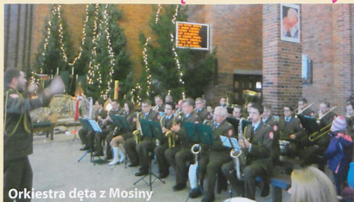
Orkiestra dęta z Mosiny