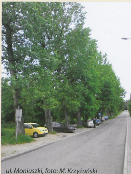
ul. Moniuszki

W czerwcu 2012 r. do mieszkańców Puszczykówka dotarła nieoficjalna wiadomość o zamiarze wybudowania na naszym terenie dwóch ogromnych obiektów handlowych. Przyjęliśmy tę informację z niedowierzaniem, uznając ją za całkowicie absurdalną.