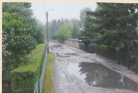
ul. Solskiego