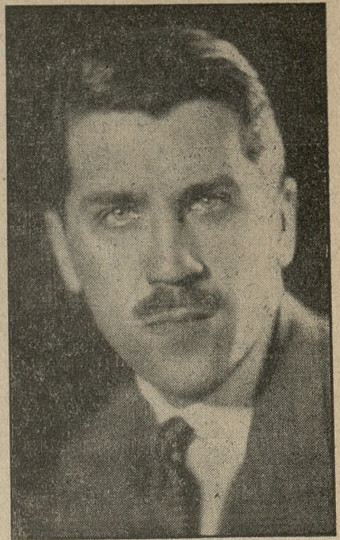
Mikołaj Orłow światowej sławy pianista rosyjski przyjechał do Poznania i wystąpi jutro w środę, w auli uniwersyteckiej.

„AZS” — „Polonia” ostatnie i zarazem decydujące spotkanie o mistrzostwo Polski