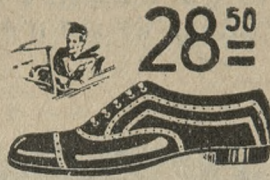
Półbuty męskie, trwałe, eleganckie, całe ze skóry.