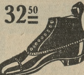
Buty męskie, wytworne, mocne całe ze skóry.