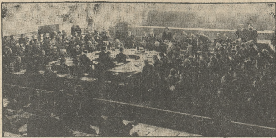
Posiedzenie Rady Ligi Narodów, na którym postanowiono przyłączyć Saarę do Niemiec, przyczem jako datę przyłączenia ustalono 1 marca.