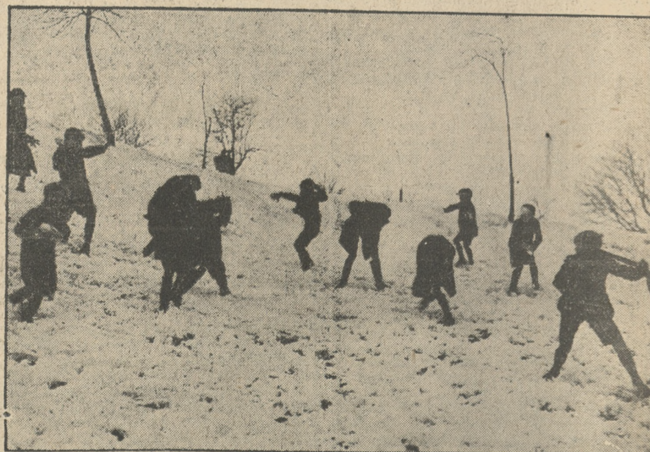
Scena z zabawy „w wojnę”: kanonada śnieżkami.

Rząd hiszpański postanowił zorganizować komunikację lotniczą pasażerską na dystansie Madryt — Paryż i Madryt — Baleary. Na obu liniach będą kursować trzy motorowe aparaty Dornier, rozwijające szybkość do 300 km na godzinę. Przelot na linii Madryt — Paryż będzie trwał razem tylko pięć godzin, a na linii Madryt — wyspy Balearskie (Majorka) — trzy godziny. Będzie to najszybsza komunikacja między Paryżem a Madrytem, gdyż ekspresy przebiegają tę przestrzeń w ciągu 14 godzin.