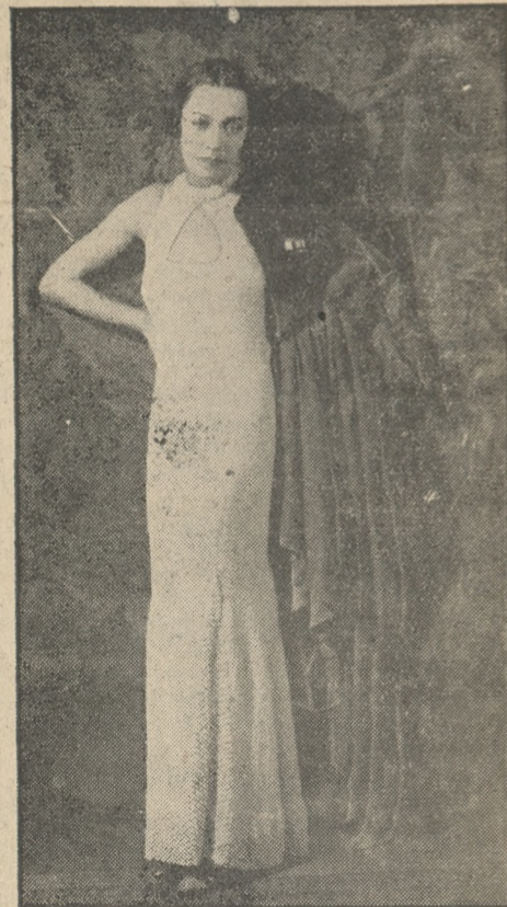
Z najnowszej mody paryskiej: Suknia wieczorowa z białego trykrotu. Model Nagorhoff.

micznego jest doniosłe. Woda działa rozpuszczającą na sole wydzielane z potem, na brud i pył, jaki tkwi w powłokach skórnych. W użyciu wody do zabiegów oczyszczających należy uwzględnić zawartość w niej najrozmaitszych soli.