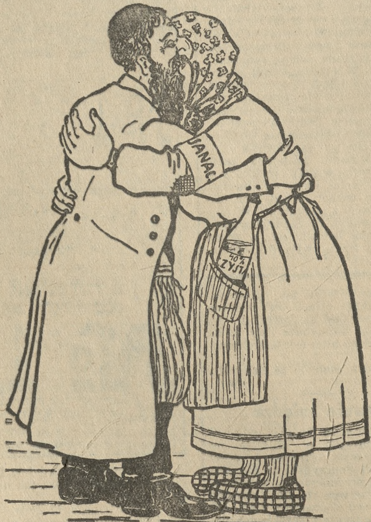
„Sanacyjno” - żydowskie czułości przedwyborcze

Nową wystawę dekoracyjną przygotowują pracowni malarskie pod kierunkiem p. Stanisława Węgrzyna.