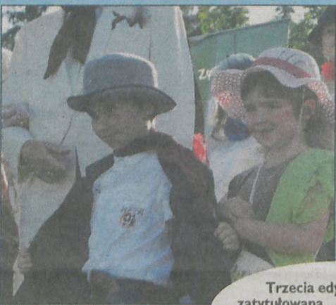
Trzecia edycja imprezy zatytułowana „Automobil czar” była okazją do poznania starych samochodów