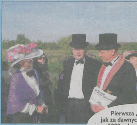
Pierwsza „Promenada jak za dawnych lat” odbyła się w 2009 roku. Licznie przybyli śremianie spacerowali w strojach retro po promenadzie