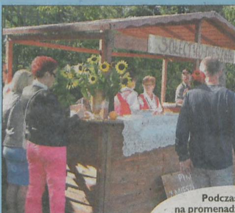
Podczas imprezy na promenadzie w 2014 roku było bardzo smacznie. Uczestnicy wydarzenia próbowali staropolskich potraw