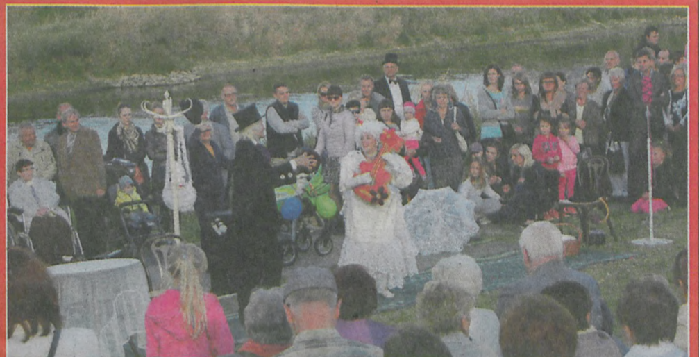
▲ Przed śremianami wystąpił Teatr Nikoli