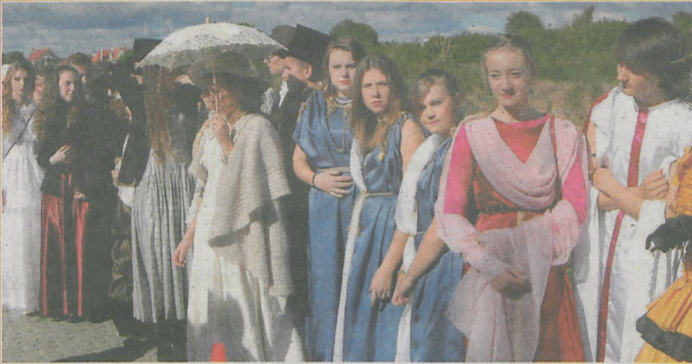
▲ Uczestnicy „Promenady jak za dawnych lat” z ochotą prezentują swoje stroje