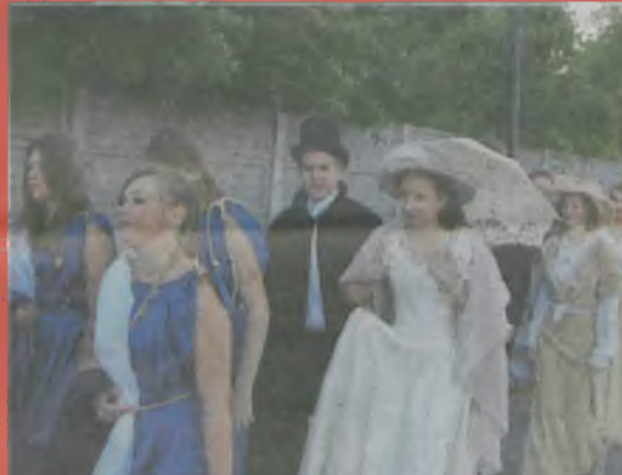
▲ Nie zabrakło także młodzieży w pięknych kostiumach