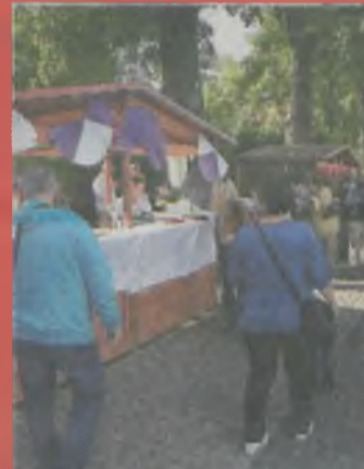
▲ Podczas imprezy skosztować można było lokalnych wyrobów