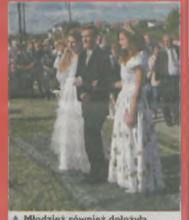
▲ Młodzież również dołożyła wszelkich starań, aby ich stroje nawiązywały do tytułowej „Romantyczności”