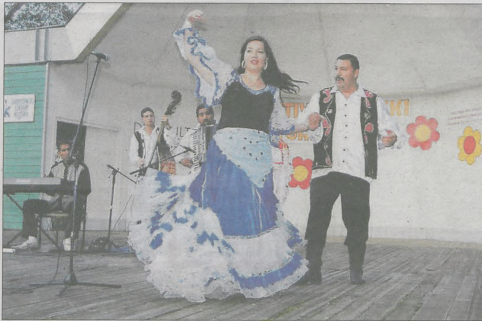
▲ Cygańskie stroje zachwycają, ale też inspirują artystów i projektantów