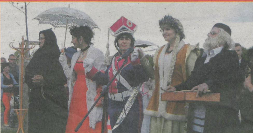
▲ Wśród przebranych gości znaleźli się także bohaterowie „Pana Tadeusza”