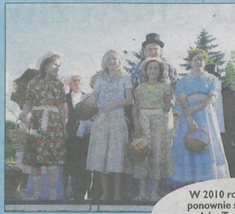
W 2010 roku śremianie ponownie spotkali się na promenadzie. Tym razem w czerwcu. Hasło imprezy brzmiało „Bulwar sztuki”