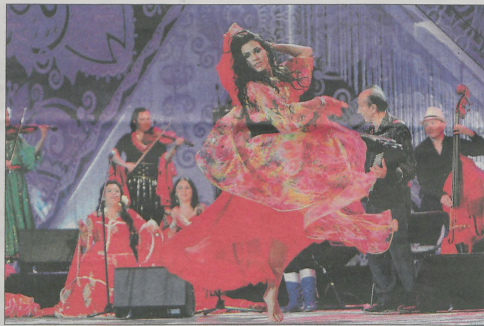
▲ Podczas imprezy na promenadzie będzie okazja, aby lepiej przyjrzeć się cygańskim strojom. Zapewnią taką możliwość artyści z Teatru Terno

Choć, jak już pisaliśmy, mężczyźni porzucili tradycyjne stroje, to jednak i oni trzymają się kilku zasad podczas doboru stroju. Zamiast jeansowych spodni i koszul, Romowie wybierają spodnie z materiału i całe garnitury. Cenią sobie szyk i elegancję, ale połączoną z odpowiednią dawką ekstrawagancji i tak ukochanej przez Romów wystawności. Obfita i przesadna biżuteria oraz jaskrawe barwy nadal są cechami charakterystycznymi dla wielu romskich mężczyzn. Częstym elementem tych stylizacji są długie, czarne, klasyczne