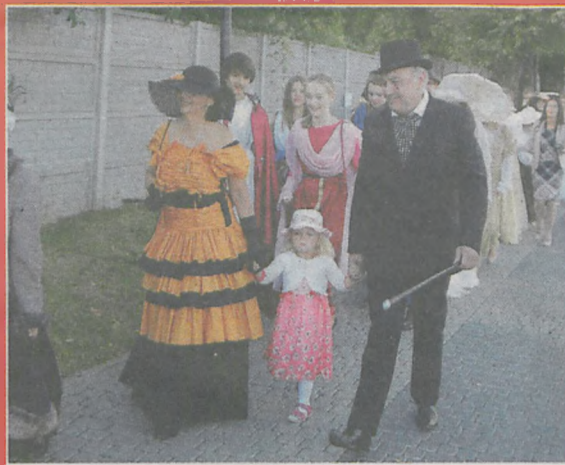
▲ Śremianie jak co roku, stanęli na wysokości zadania, i przygotowali piękne stroje