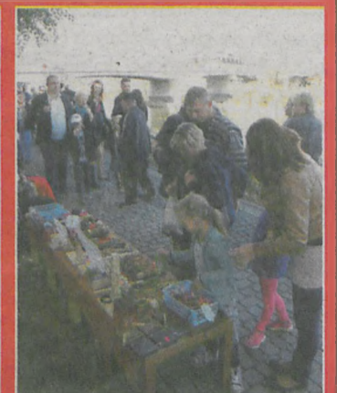
▲ Jak zawsze na promenadzie można było kupić rękodzieło i upominki