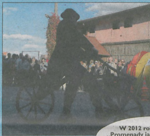
W 2012 roku uczestnicy „Promenady jak za dawnych lat” jeździli na starych bicyklach