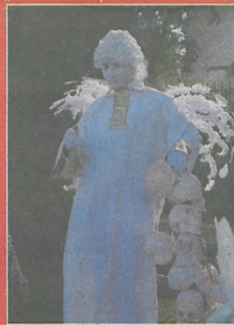
▲ Nad Wartą tego dnia spotkać można było ciekawe postaci