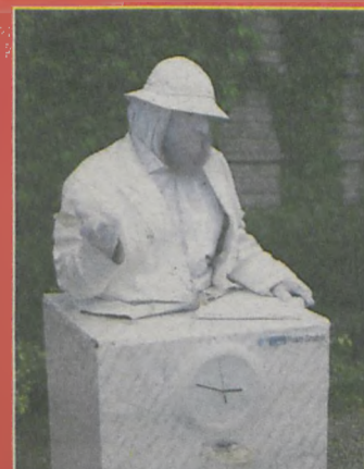
▲ Był też Pisarz Grodzki