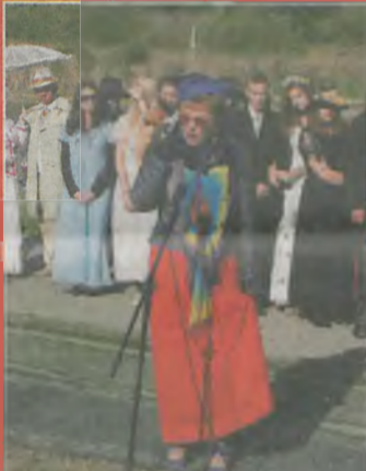
▲ Był czas na krótkie prezentacje każdego z uczestników