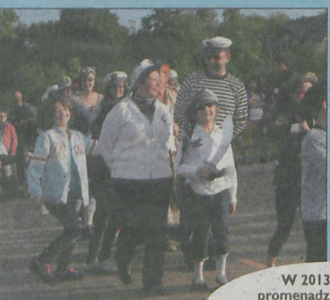
W 2013 roku na promenadzie królowały marynarskie paski. Żeglarskie klimaty przypadły do gustu licznie przybyłym śremianom