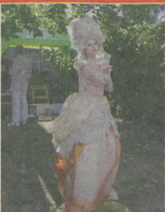
▲ Trudno było tego dnia przejść obok żywych rzeźb, choć na chwilę przy nich nie zatrzymując