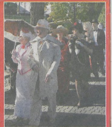
▲ Spacer po słonecznej promenadzie w pięknych strojach sprawiał uczestnikom imprezy wiele radości