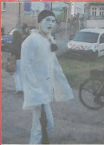
▲ Artysci starali się bawić i zadziwiać uczestników imprezy