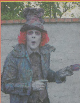
▲ Duże zainteresowanie wzbudziły kreacje Szalonego Kapelusznika