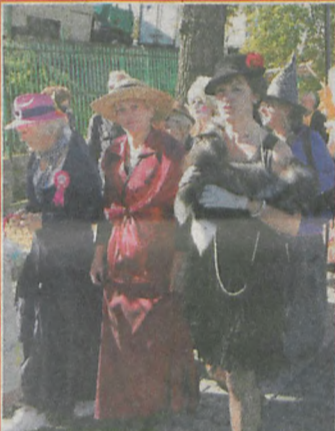
▲ Panie zachwycaly pięknymi sukienkami i obowiązkowymi kapeluszami