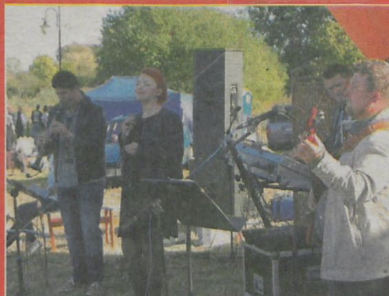
▲ Nie zabrakło muzyki granej na żywo