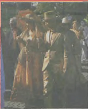
▲ Rok temu temat imprezy brzmiał „Romantycznie”. Na promenadzie śremianie spotkać mogli artystów w roli żywych rzeźb