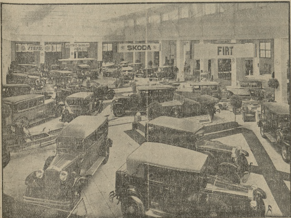
Dział samochodowy zajmuje na wystawie poczesne miejsce i przedstawia się bardzo ciekawie. Jako ilustrację do naszych opisów podajemy powyższe zdjęcie, przedstawiające jeden z fragmentów tej wystawy.