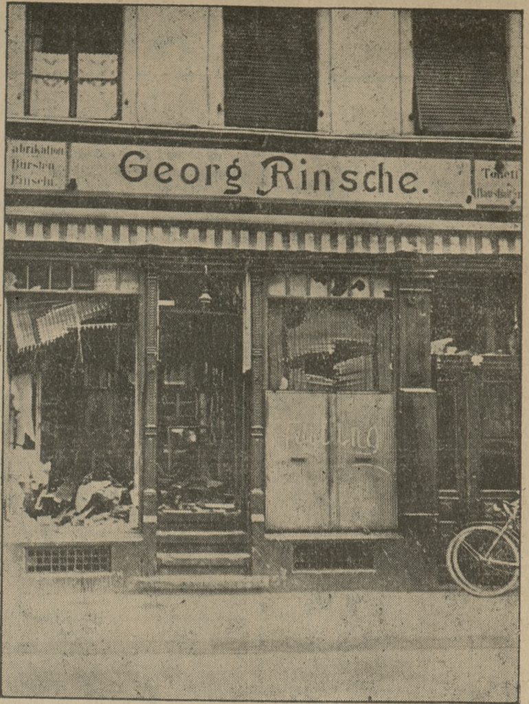
Po odejściu wojsk okupacyjnych w niektórych miejscowościach Nadrenji Niemcy zaczęli się rozprawiać z jednostkami, które były przychylnie usposobione dla okupantów. Fotografia podaje sklep kupca zdemolowany i napiętnowany napisem „Feigling”

Kto zna obyczaje krajów północnych, wie doskonale, jak bardzo mieszkańcy północy przepadają za pstrągami. Nie też dziwnego, że ogłoszenie, jakie się pokazało w prasie norweskiej a donoszące o założeniu „wielkiego koncernu przemysłowego dla sztucznych jaj pstrągów”, wywołało w całym kraju niemalą sensację, radość i zaciekawienie. Jajka miały być sztucznie wytwarzane w laboratorium chemicznem. Ogłoszenie donosiło, że koncern, o którym mowa, nie wymaga wpłaty 10 koron z góry — za dostawę setki sztucznych jaj pstrągów, lecz żąda zobowiązania od nabywającego, że kwotę tę uiszc po... przyjsciu na świat młodych pstrągów, mających się wylęgnać z nadesłanych przez koncern sztucznych jaj. Zbytecznem jest chyba dodać, że zgłosiło się kilkanaście tysięcy amatorów, z których większa część pieniądze nadesłała już z góry. Po kilku tygodniach jednak —