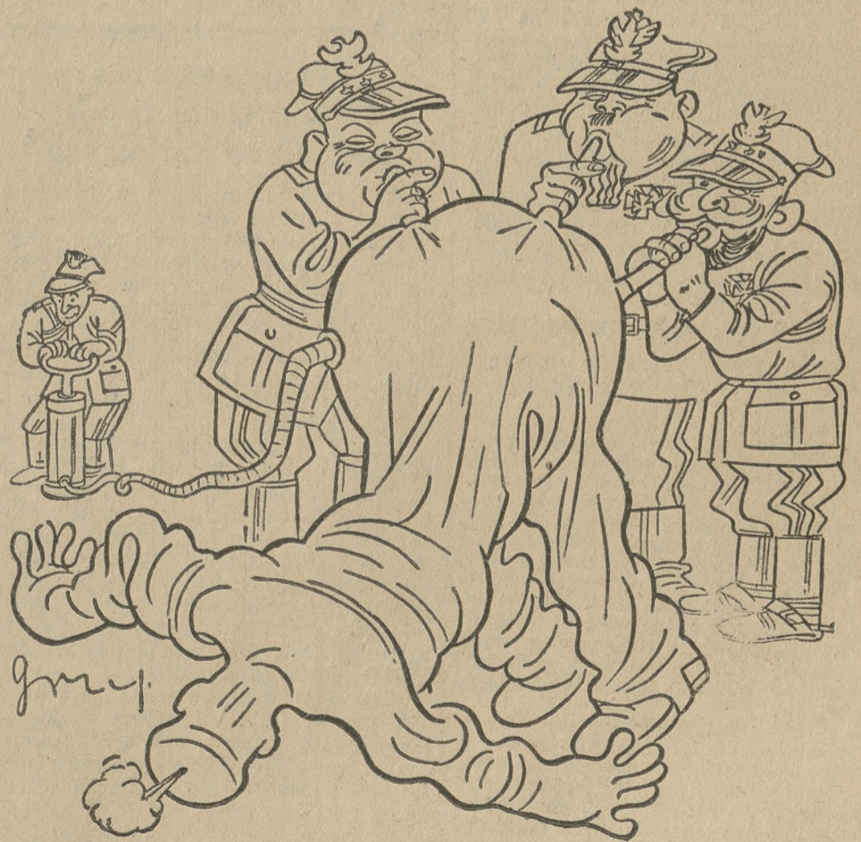
Dajcie spokój, panowie! Już tej włóczki nie nadmuchiacie!