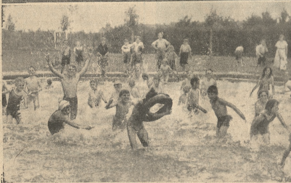
Śmiechem i gwarem rozbrzmiewa brodzianka przy ul. Bukowskiej. Upał nie dokucza tutaj naszym milusińskim.

brodząc i pluskając się wesoło w wodzie. Po niektórych dzieciakach poznać, że nie pierwszy raz tu przebywają, o czym świadczy ich mocno opalone buzie, plecy i nogi.