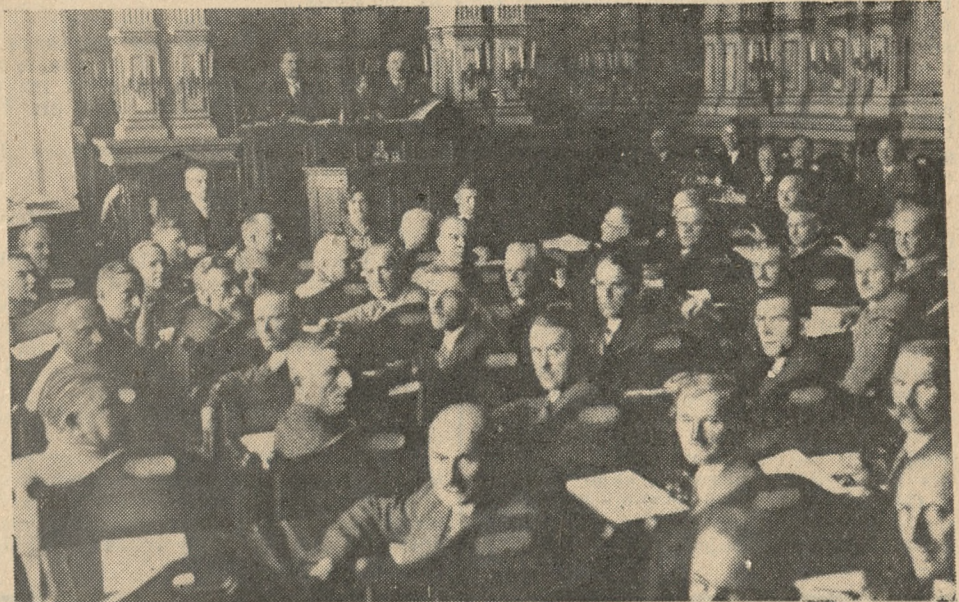
Fragment z otwarcia XIV sesji Sejmiku Wojewódzkiego w sali Starostwa Krajowego w dniu wczorajszym.

Rodakami na Obczyźnie, prezesem Komitetu Budowy Pomnika Serca Jezusowego w Poznaniu.