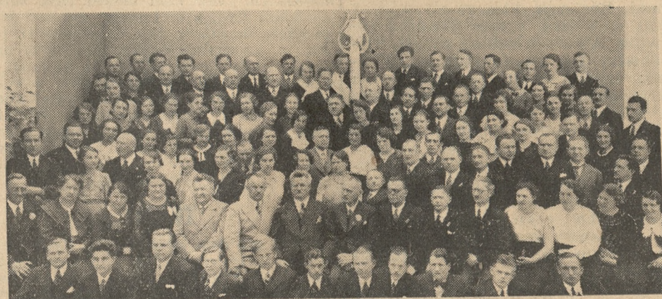
Koło śpiew. „Demiński” w Lesznie

Po południu odbyły się zawody konkursowe, których wyniki są następujące: III kat. chór mieszany: I „Lutnia” Osieczna 20 2/3 pkt., II „Moniuszko” Pawłowice 20 1/3 pkt., III „Hejnał” Wijewo 20 pkt., IV „Halka” Rydzyna 18 pkt. I kat.: I „Demiński” Leszno 25 1/3, II „Nowowiejski” Zaborowo 18 1/3. Chór męski: I „Demiński” Leszno 23 pkt., 2. „Cecylja” Bukowiec Górny 17 1/3 pkt. W I kat.: I „Demiński” Rawicz, II „Chopin” Leszno. Nagrodę w I kat., ufundowaną przez wydział pow., zdobył „Demiński” Rawicz. W II kat. nagrodę, ufundowaną przez zarząd miasta Leszna (20 śpiewników Wlkp.), zdobył „Demiński” Leszno.