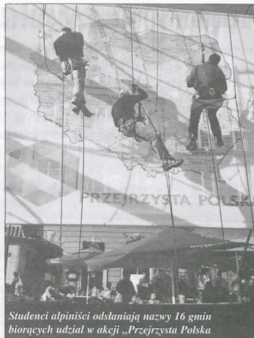
Studenci alpinistyczni odslaniają nazwy 16 gmin biorących udział w akcji „Przejrzysta Polska”

Akcję będzie można śledzić w portalu gazeta.pl/przejrzystapolska . Znajdziecie tam Państwo informacje, zadania, wiadomości o postępach w ich realizacji. A także forum dyskusyjne dla mieszkańców, pełniące funkcję kontroli społecznej. Patronat Medialny: Telewizja Polska i I PR Polskiego Radia. Gabriela Ozorowska