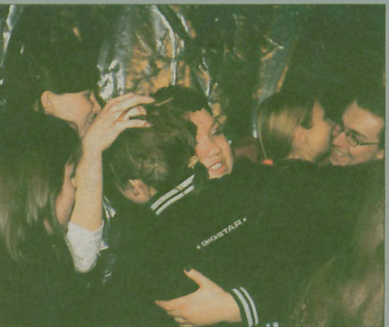
PODCZAS JAROCIŃSKIEGO PRZEGLĄDU ważniejsza jest przyjaźń niż rywalizacja. Dlatego wszyscy gratulowali sobie nawzajem obiecując kolejne spotkanie za rok