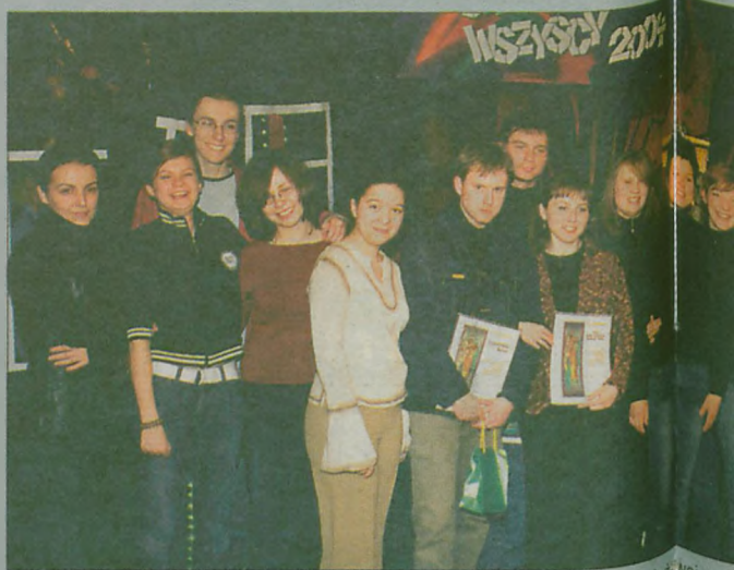
LAUREACI XIII Międzynarodowego Przeglądu Piosenki Młodzieżowej „Śpiewajmy Wszyscy” Jarocin 2004