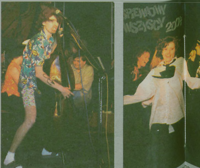
SZKODA, że musiano zrezygnować z koncertu galowego, bowiem na scenie często panowała szalona zabawa