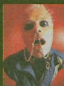
Keith Flint (Prodigy)