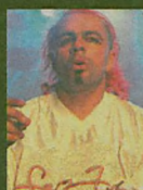
Glacya Sweet Noise