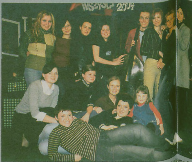
„RODZINNA” fotografia słuchaczy Studia ABC Piosenki Jarocińskiego Ośrodka Kultury