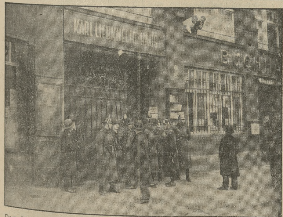
„Dom Liebknechta” w Berlinie wymieniany w związku z nową aferą komunistyczną w Niemczech. Podczas rewizji zaczęły się zbierać tłumy na ulicy i doszło do awantur oraz demonstracji za Sowietami.