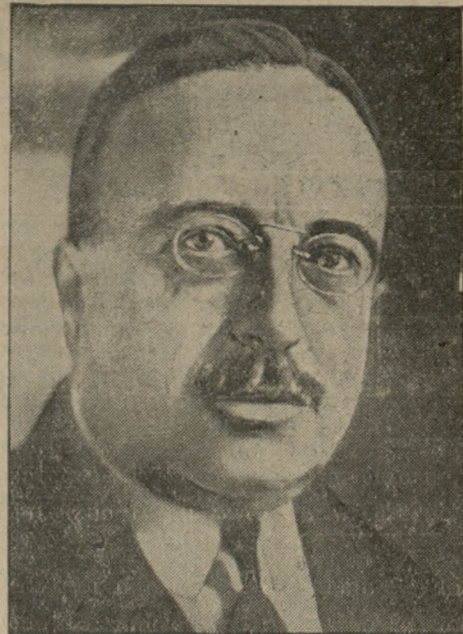
Francuski prezes ministrów Tardieu, który wraz z całym gabinetem podał się do dymisji wskutek nieudzielenia przez Izbę 286 głosami przeciwko 281 votum zaufania ministrowi finansów Chéronowi.

W województwach zachodnich Polski istnieje cały szereg orkiestr, powstałych przy prywatnych instytucjach i organizacjach społecznych nie dla celów zarobkowych lecz ze względów ideowych. Inicjatorzy tych orkiestr doceniają w całej pełni uszlachetniający wpływ muzyki nietylko na grających w danym zespole, lecz i na całe otoczenie, zainteresowane rozwojem własnej orkiestry. Znaczenie to powinien poznać również szerszy ogół, a niewątpliwie nie poskąpi on poparcia takim orkiestrom.