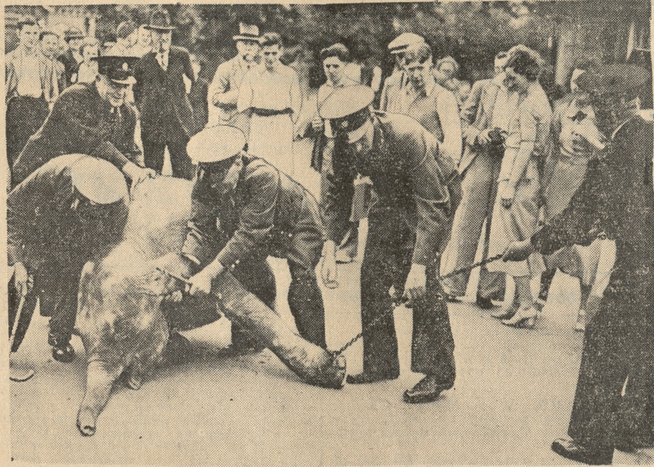
Londyński zwierzyniec posiada swą osobliwość w młodym 5-miesięcznym słoniu. Na zdjęciu widzimy kłopoty dozorców z młodym urwisem, który krnąbrnością swą narobił nielada ambarasu.

Trzeba by niezliczonych godzin i dni, by opisać cuda nauki, znajdujące się w Pałacu Wynałazków. Oto znajduje się przed nami samolot Blériota, na którym znany konstruktor przeleciał pierwszy kanał La Manche w 1909 roku; dalej zwiisa pierwszy balon z 1783 r.; podziwiamy najstarszy na świecie automobil... parowy, pochodzący z 1770 r., a zamówiony przez