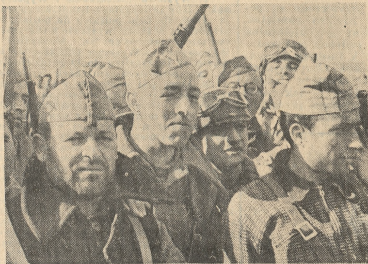
ROZBITY „BATALION ŚMIERCI”

Reszta bolszewickiego „batalionu Śmierci” rozbitego przez powstańców hiszpańskich pod Madrytem.