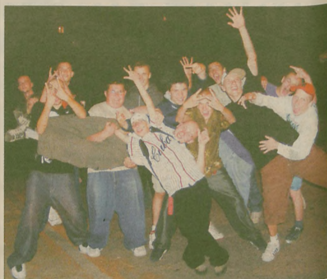
NISKA FREKWENCJA nie zabija dobrego humoru

P.S. Jak na ironię, wyżej podpisani hip-hopu nie słuchają