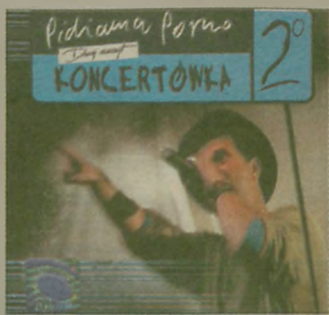
Nagrodę ufundowało S.P. Records