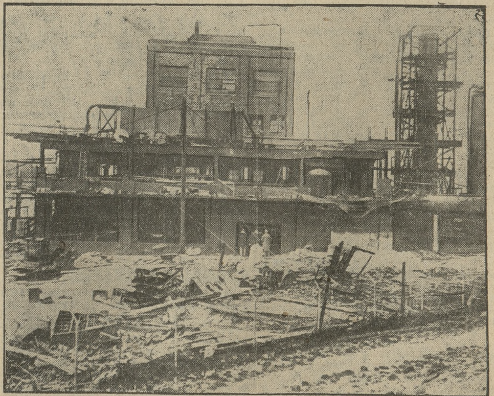
Skutki eksplozji w rafinerji alkoholu z zakładów Standard Oil Co. w Ameryce. Zginęło przytem 16 osób, a 57 jest rannych, którym w przeważnej części grozi utrata wzroku.