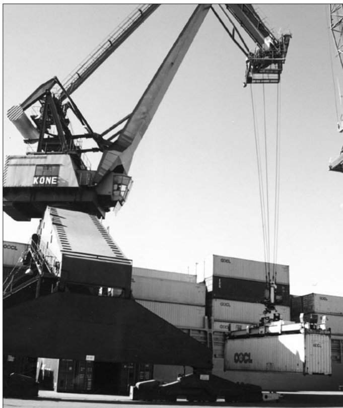
Przeładunek kontenerów w Gdańskim Terminalu Kontenerowym w Porcie Gdańskim.