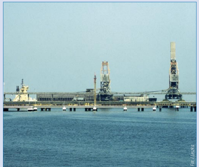
Pirs paliwowy w Porcie Północnym.