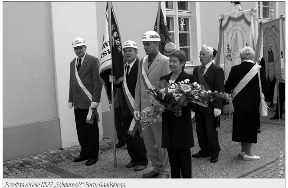
Przedstawiciele NSZZ „Solidarność” Portu Gdańskiego.

corocznych pielgrzymkach ludzi pracy w Częstochowie. Wiemy ile trudu włożył w przygotowania tych niezapomnianych pielgrzymek Papieża na Wybrzeże w 1987 i 1999 roku. Jako portowcy wspieraliśmy go w tej posłudze, bo ona także służyła nam. Kiedy w sierpniu 1988