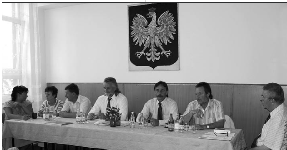
Przedstawiciele władz spółki „Aqua-Port”.

W dniu 14 czerwca 2005 r. w Przedsiębiorstwie Usługowo-Produkcyjnym „Aqua-Port” - spółka z o.o. odbyło się Zwyczajne Zgromadzenie Wspólników.