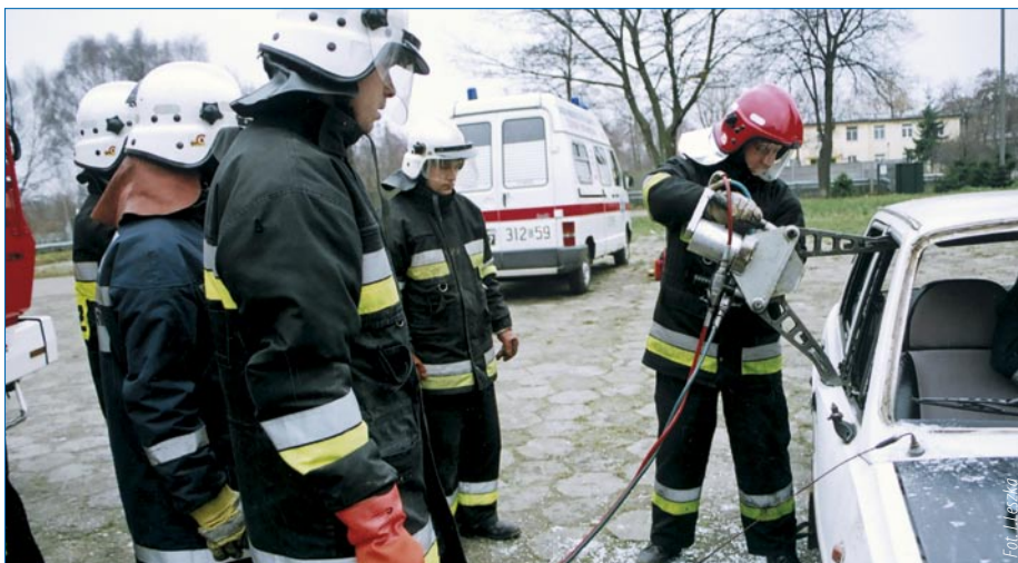
Ćwiczenia portowych strażaków.

Chuck Norris jest jedyną osobą, który ułożył kostkę Rubika w jednym ruchu – kopnął ją z półobrotu.