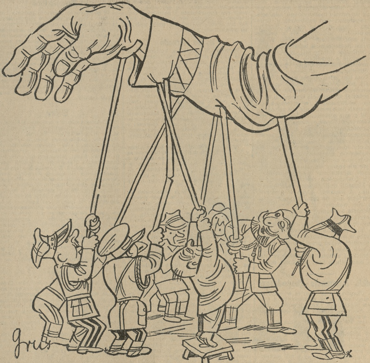
Podpiszajmy, koledzy, bo inaczej ręka kłapnie