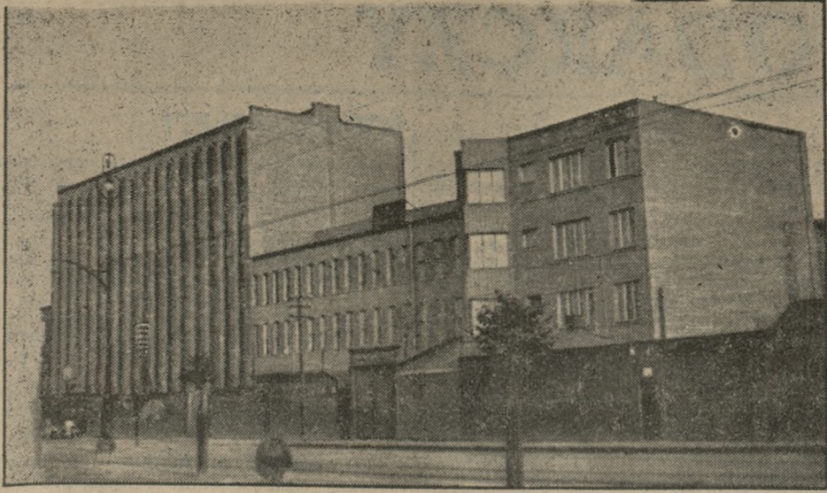
Fotografia powyższa przedstawia nowobudujący się gmach państwowej wytwórni telefonów i telegrafów przy ul. Grochowskiej nr. 13 w Warszawie. gdzie wykryto olbrzymie nadużycia, sięgające 4 milionów złotych. Sprawcą nadużyć okazał się dyrektor wytwórni Józef Jędrzejewski, znany działacz „sanacyjny” z pod znaku B. B. S.