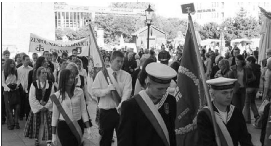
Klub Szkół Westerplatte.

W tym roku, we wrześniu, mija 45 lat od powstania placówki oświatowej powołanej do kształcenia przyszłych pracowników portowych. „Szkoła Dokerów” od 1961 roku, idąc z duchem czasu oraz wychodząc naprzeciw potrzebom rynkowym, przeszła transformacje i stała się jedną z najpopularniejszych szkół w Trójmieście.