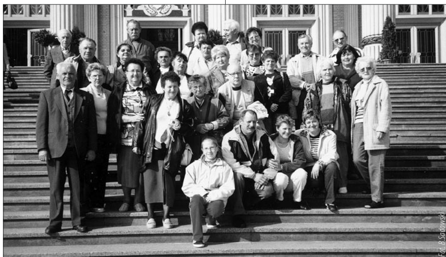
Portowi Pielgrzymi na schodach Bazyliki w Licheniu...

nia, do czynienia rzeczy dobrych, jednym słowem pomaga godnie przejść przez życie. Każdy z nas wędruje własnymi ścieżkami, walczy z własnymi demonami, wsłuchuje się w siebie pragnąc usłyszeć, czy zobaczyć anioła i nie wie, że to może być koleżanka, która podaje kawę, że to może być sąsiad, który przyszedł coś pożyczyć, albo zgoła biedny, który nieśmiało puka do drzwi prosząc o datek. W trakcie spotkania z boskością umykają sprawy powszednie, następuje niezrozumiałe przeobrażenie osobowości, katarsis - oczyszczenie. Wracamy jacyś lepsi, doskonalsi, wyciszeni. I za to, że po raz kolejny było nam dane wziąć w niej udział - dziękujemy.