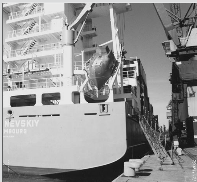
Nabrzeże Szczecińskie - Gdański Terminal Kontenerowy.