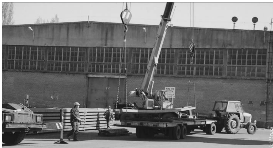
Nabrzeże Wiślane PG Eksploatacja – podładunek wyrobów stalowych w relacji plac-burta.

W straży pożarnej dzwoni telefon. - Dzień dobry, czy to ZUS? - ZUS spłonął. Po pięciu minutach znowu dzwoni telefon. - Dzień dobry, czy to ZUS? - ZUS spłonął. Po następnych pięciu minutach znowu dzwoni telefon. - Dzień dobry, czy to ZUS? - Ile razy mam panu powtarzać, że ZUS spłonął! - odpowiada wściekły strażak. - Ale jak przyjemnie tego posłuchać.