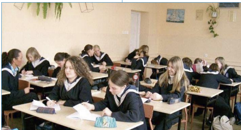
Sala lekcyjna w ZSM.