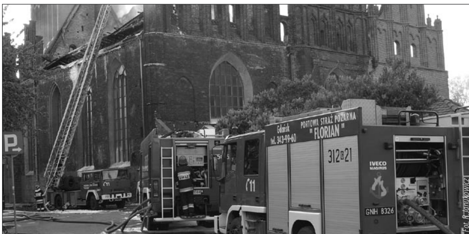
Portowa Straż Pożarna „Florian” w akcji gaśniczej kościoła Św. Katarzyny.