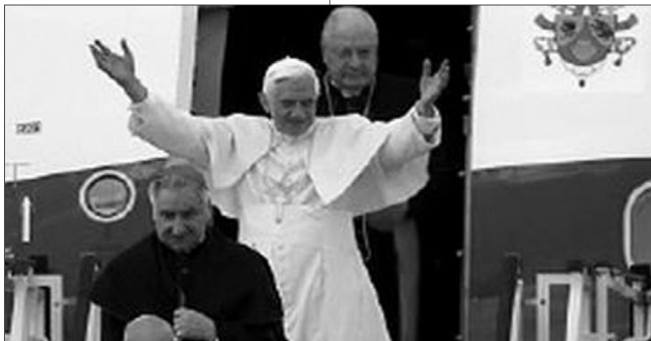
Papież Benedykt XVI wylądował o godzinie 11.00 na lotnisku Okęcie w Warszawie.

Niech nie zabraknie światu waszego świadectwa - zachęcał Ojciec Święty. Zanim powrócę do Rzymu, by kontynuować moją posługę, kieruję do was wszystkich tę zachętę, nawiązując do słów wypowiedzianych na tym miejscu przez Jana Pawła II w 1979 roku: „Musicie być mocni, drodzy Bracia i Siostry! Musicie być mocni tą mocą, którą daje wiara! Musicie być mocni mocą wiary! Musicie być wierni! Dziś tej mocy bardzo wam potrzeba niż w jakiegokolwiek