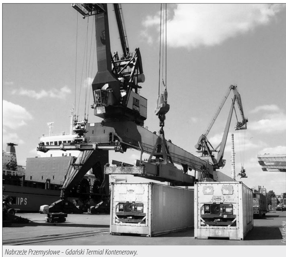
Nabrzeże Przemysłowe - Gdański Terminal Kontenerowy.