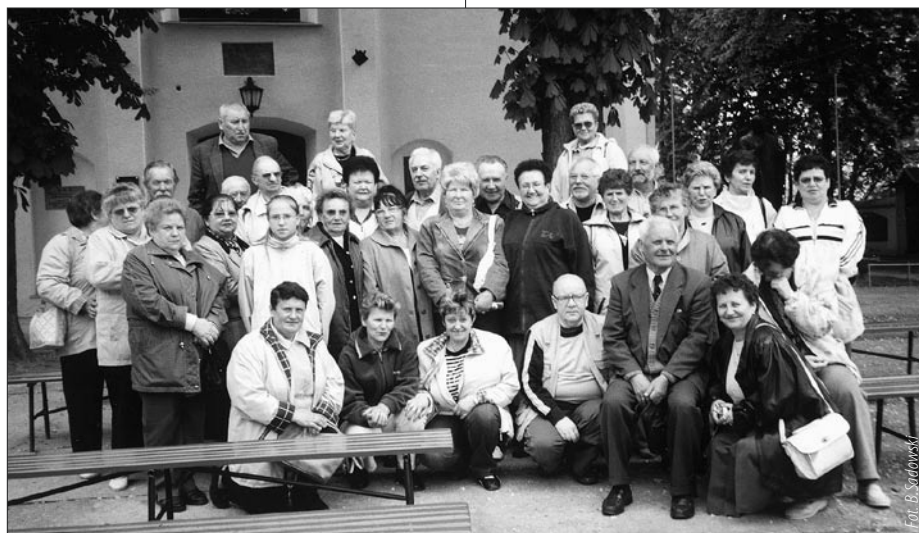
... i w Sanktuarium Maryjnym w Oborach.

Emeryt nieco inaczej postrzega rzeczywistość, ma bowiem świadomość upływu czasu. Wszechobecny Zegarmistrz z nieubłaganą dokładnością odlicza nam lata, miesiące, godziny - ten zegar wyraźnie się spieszy. Coraz częściej myślimy o tym co nas czeka za żelazną bramą, wrotami bez powrotu, dlatego coraz częściej zwracamy się do Boga, do Matki Bożej. Wiara dla nas jest natchnieniem, pozwala pokonać trud, strach, ból, niepokój. Wiara pobudza do działa-