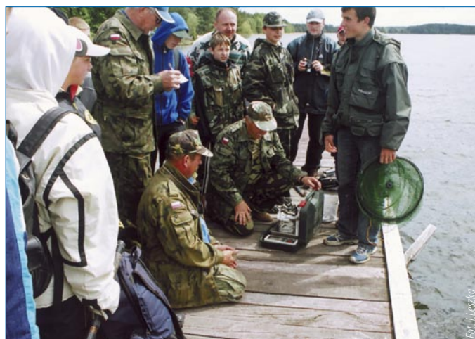
Ciekawe, kto wygra? Ważenie ryb po zawodach to najbardziej ekscytujący moment.