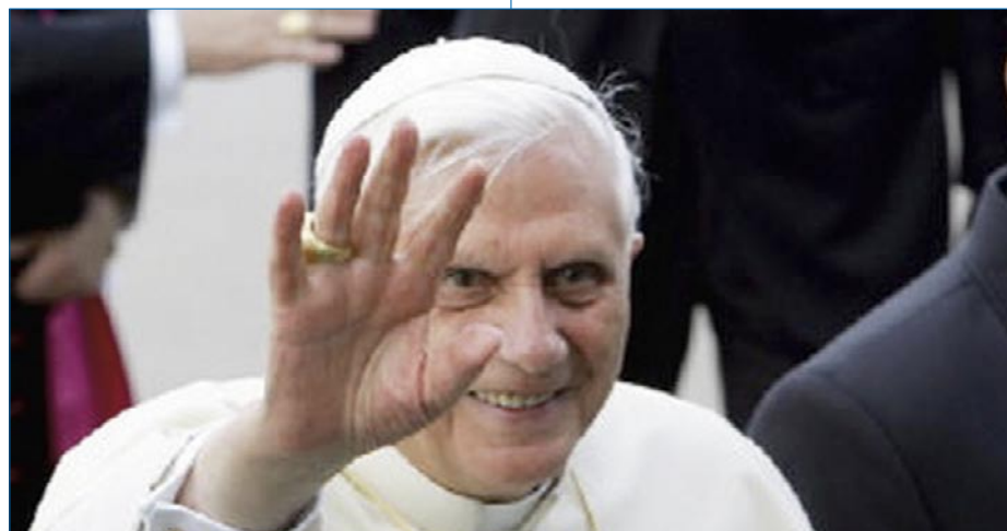
Papież Benedykt XVI przed odlotem do Rzymu żegna się z Polakami.

Ojciec Święty zaznaczył, że w tym miejscu rodzą się pytania do Boga, dla-