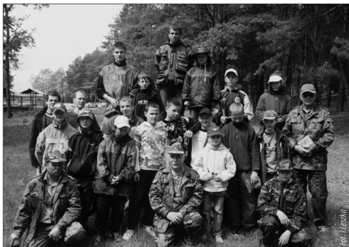
Młodzi wędkarze wraz z opiekunami biorący udział w zawodach.

zawodów okazało się przydatnych i zawodnik ten zaczął sobie doskonale radzić nie tylko z wędką ale także i z łowieniem ryb. Po zawodach jak co roku tak i w tym na zawodników czekały atrakcyjne nagrody, które zostały wręczone przez organizatorów zawodnikom w kolejności od zajętych miejsc w swych grupach.