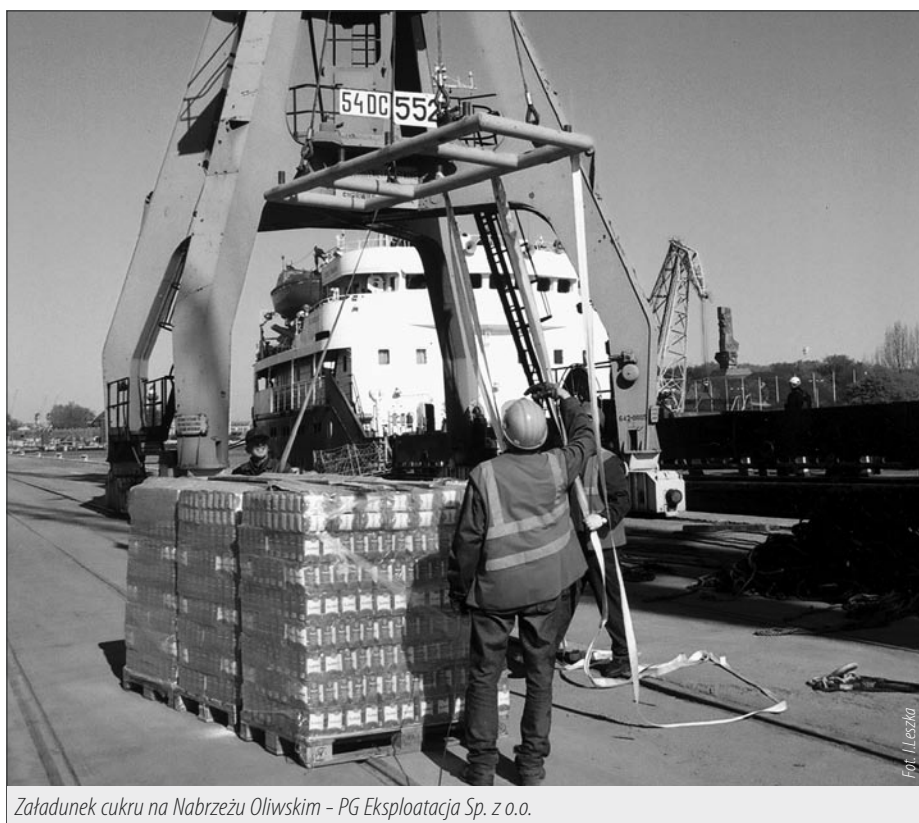
Załadunek cukru na Nabrzeżu Oliwskim - PG Eksploatacja Sp. z o.o.