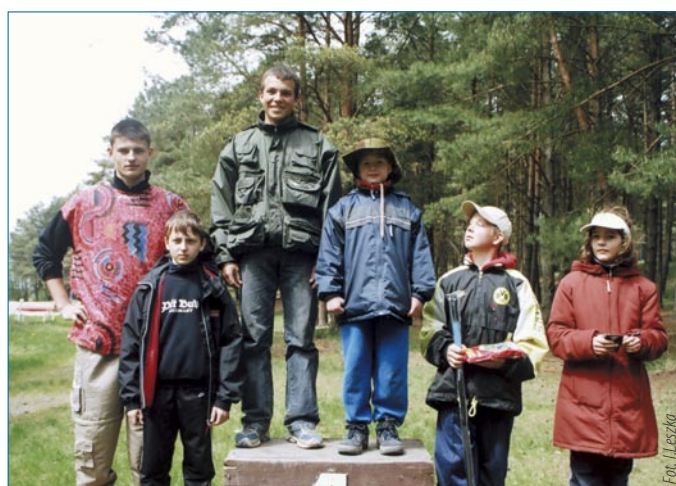
Pierwsza szóstka zawodów w swych grupach wiekowych.