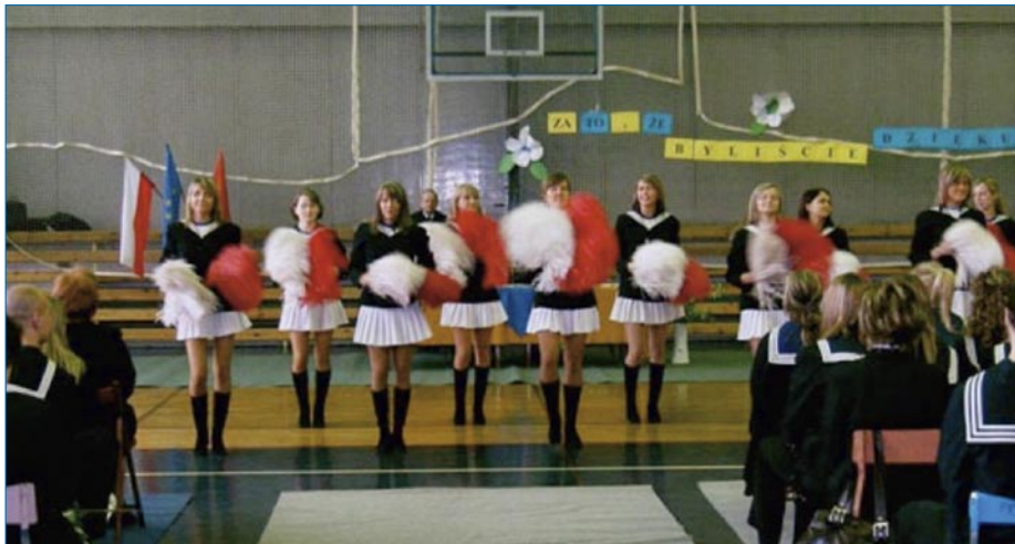
Uroczystość pożegnania absolwentów ZSM.

Unii Europejskiej tzw. sala unijna. Istnieją w szkole ponadto trzy pracownie informatyczne oraz Szkolne Centrum Informacji.