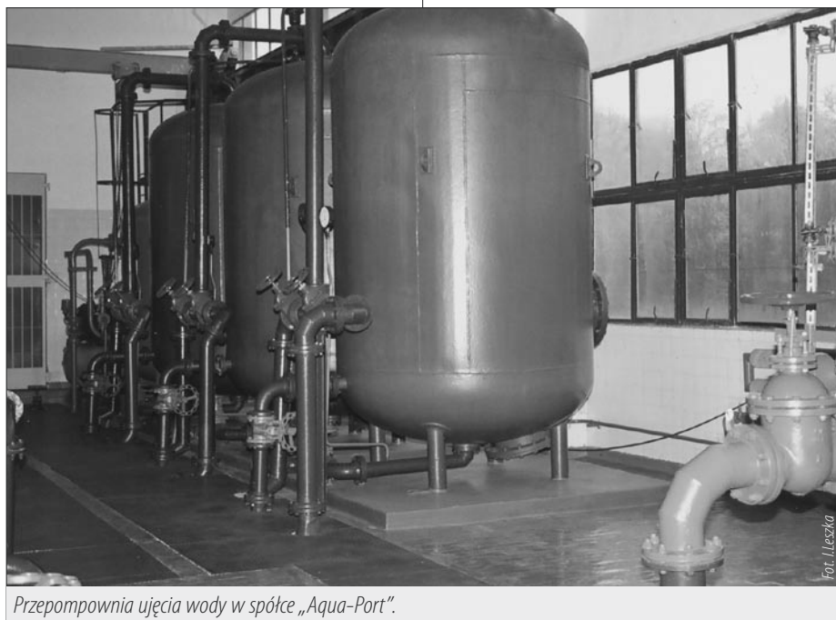
Przepompownia ujęcia wody w spółce „Aqua-Port”.