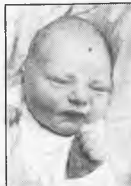
8. Syn państwa Szewczyków z Koźmina, ur. 3 stycznia