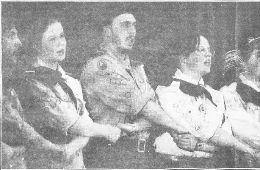
Braterski splećny krąg...