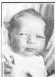
1. Córka państwa Handke z Koźmina, ur. 2 stycznia

A oto mieszkańcy gminy Krotoszyn i gmin sąsiednich, urodzeni na oddziale położniczym szpitala przy ulicy Bolewskiego, sfotografowani przez Marcina Pawlika.