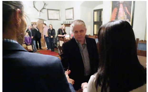
7.10., Muzeum Zamek Opalińskich w Sierakowie, „To co żywe zostaje w nas – 1050. rocznica chrztu Polski”, podsumowanie Powiatowego Konkursu Fotograficznego im. Ireneusza Linde