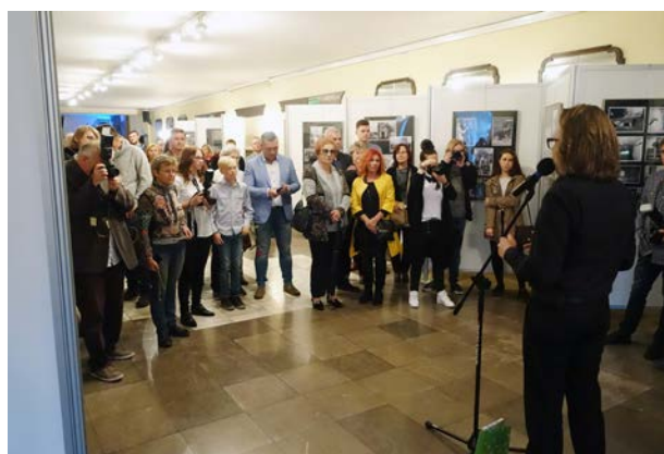
4.10., Regionalne Centrum Kultury – Fabryka Emocji w Pile, Piłska Grupa Fotografii KADR, „Mój fyrtel”