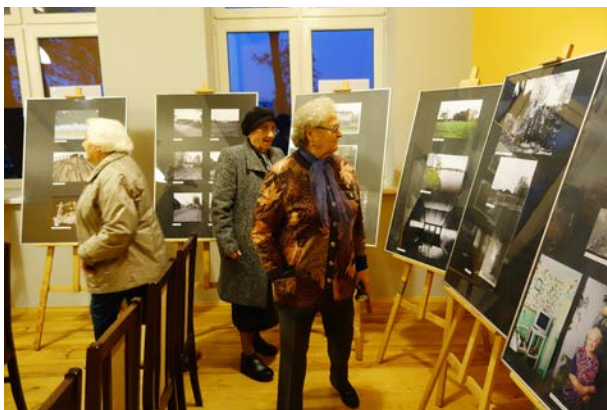
24.10., Świątlica wiejska w Gogolewie, „Fotogeniczna prowincja”