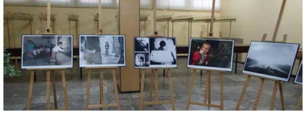
13.10., Klub 3. Skrzydła Lotnictwa Transportowego w Witkowie, „Dziecko 2016”