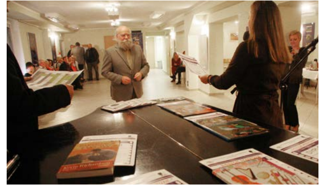
13.10., GPK w Komornikach, Klub Miłośników Fotografii „Migawka”, „Muzyczne impresje”, wystawa pokonkursowa

Kradnę kadr rzeczywistości ściskam w dłoniach pustą kliszę biel rozcina słodkie barwy obraz powielony wpada w eter