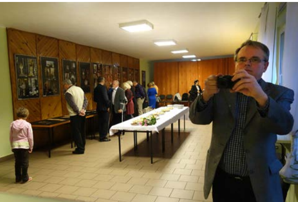
12.10., Pracownia Artystyczna Pod Patronatem Przyjaciół Dębów Rogalińskich, „Chrzcielnice”