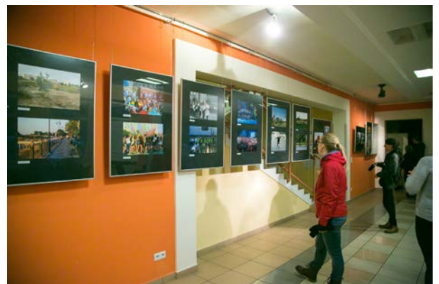
11.10., Centrum Kultury i Sztuki w Koninie, Galeria za Progiem, „Konin... moje miasto”, wystawa zbiorowa Konińskiego Klubu Fotograficznego FF