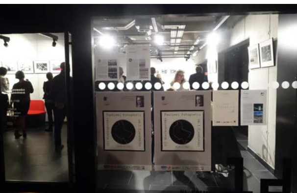
21.10., „Wiadomości Wrzesińskie”, Jerzy Wierzbicki, „Gdańsk Suburbia”