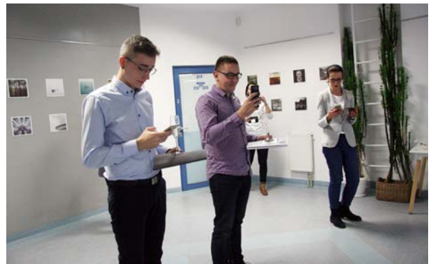
21.10., ODK ORBITA w Poznaniu, Grupa Entuzjastów Fotografii Mobilnej, „Mobilni”, „Mobilny tydzień”