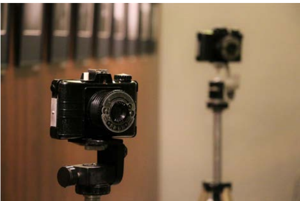
18.10., Ośrodek Kultury w Śródzie Wlkp., Średzkie Towarzystwo Fotograficzne, „DRUH – 60 lat”