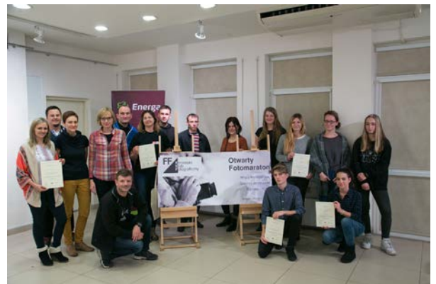
22.10., Centrum Kultury i Sztuki w Koninie, II Koniński Fotomaraton