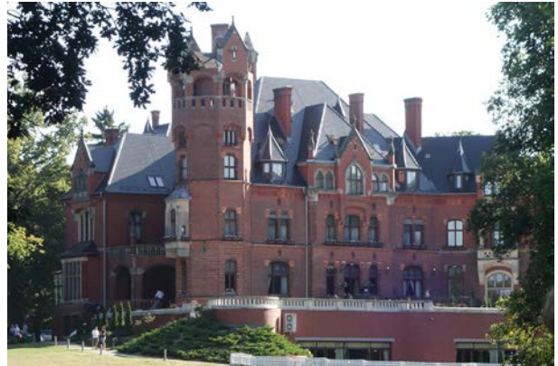
10.10., Pałac w Wąsowie, Katarzyna Olter, „Moje wizje”