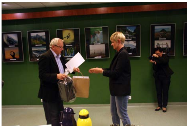
20.10., Miejska Biblioteka Publiczna w Wągrowcu Wakacje w obiektywie” – wystawa pokonkursowa