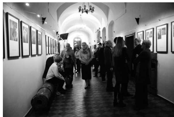
21.10., Klub fotograficzny Blenda, Galeria Refektarz i Galeria SMS w Krotoszynie, „Tu i teraz”, „Tam i wtedy”