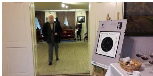
6.10., Muzeum Ziemi Średzkiej – Dwór w Koszutach, Antoni Rut, „Czarne i białe”