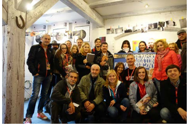
15.10., Galeria „33” w Ostrowie Wlkp., Ostrowski Maraton Fotograficzny zorganizowany przez Stowarzyszenie Ocalić Od Zapomnienia