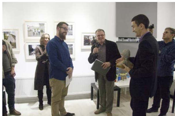
29.10., PIX.HOUSE w Poznaniu, „Prowincja – świeże spojrzenie”