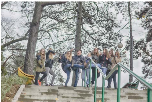
15.10., Zespół Szkół Ponadgimnazjalnych im. Józefa Nojego w Czarnkowie, „Czarnków – portret miasta”, plener fotograficzny śladami Marka Poźniaka