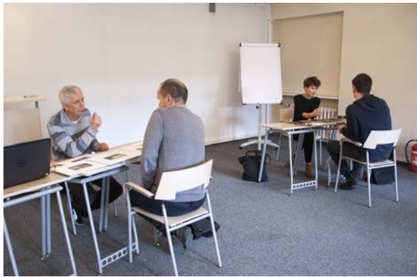
22.10., WBPICAK w Poznaniu, Przegląd Portfolio