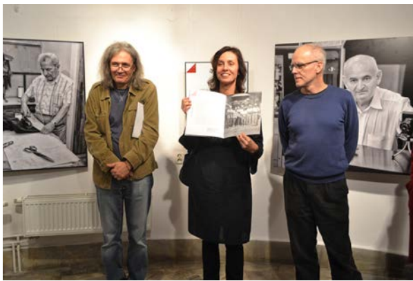
21.10., Ośrodek Kultury Plastycznej, Wieża Ciśnień w Kaliszu, „Rzemieślnicy”