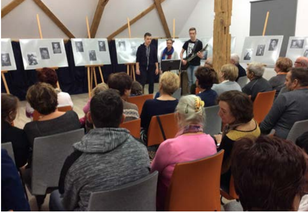
14.10., Biblioteka Publiczna Gminy i Miasta Zduny, „Zduny – moja tożsamość”