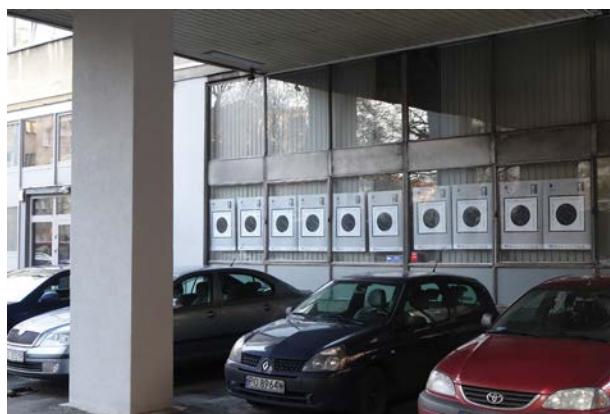
10.10-30.10., siedziba WBPICAK w Poznaniu, ul. Prusa 3

Od 10 października do końca miesiąca w 39 miejscowościach województwa odbyło się ponad 70 wystaw, spotkań i warsztatów fotograficznych. Swoje prace prezentowało 40 artystów indywidualnych, w pokazach zbiorowych – 470 twórców. W samych wernisażach uczestniczyło około 2 tysiące osób, wystawy obejrzało, według najostrożniejszych obliczeń, ponad 5 tysięcy gości. Nieoficjalnie Festiwal nabierał rozpędu od początku