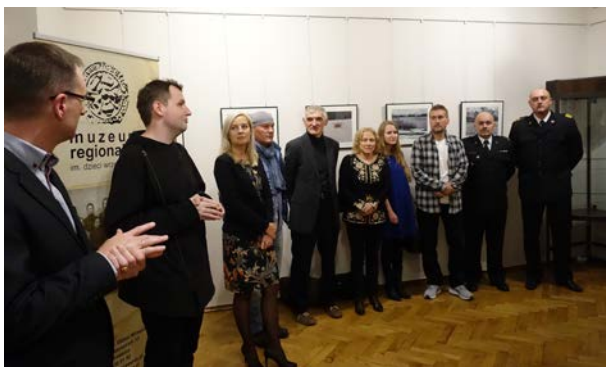
21.10., Muzeum Regionalne im. Dzieci Wrzesińskich, „Raport z fotografii 12”