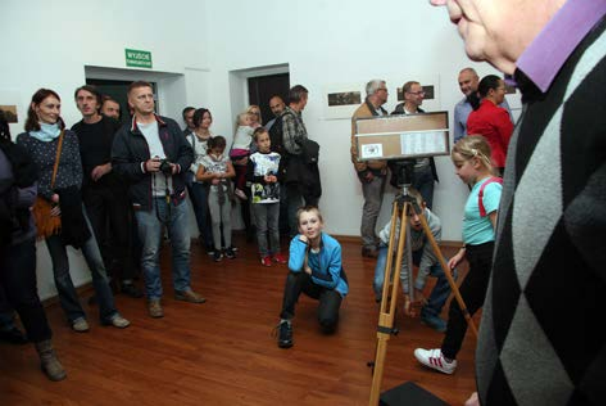
12.10., Dom Kultury w Trzemesznie, „Pejzaż sentymalny”