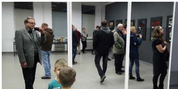
22.10., CK Scena to dziwna w Gnieźnie, Wystawa Pokonkursowa na Fotografa Roku 2016 ZPFP OW