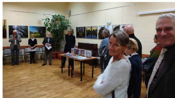
14.10., Dom Kultury Polan STO w Poznaniu, „Okrucy światła”, wystawa pokonkursowa