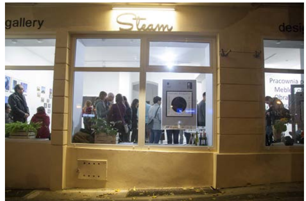
22.10., Galeria Steam w Poznaniu, Inicjatywa FOTSPOT, „K miejsce 2n ”