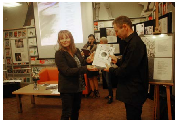
14.10., Biblioteka Uniwersytecka w Poznaniu, Grupa Literacka NA KRECHĘ, Fundacja Otwartych Na Twórczość, „Rozmowy z fotografią i poezją”