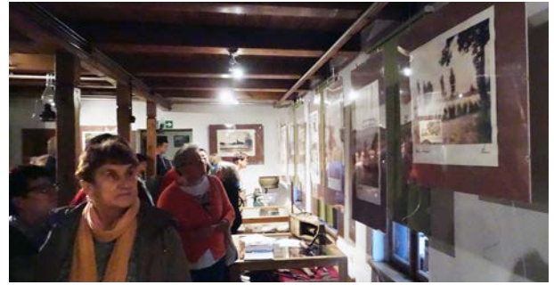
07.10., Muzeum Regionalne w Stęszewie, „Sielskie widoki okolic Stęszewa w czasie II wojny światowej w obiektywie niemieckiej propagandy” (fotografie Ernsta Stewnera)