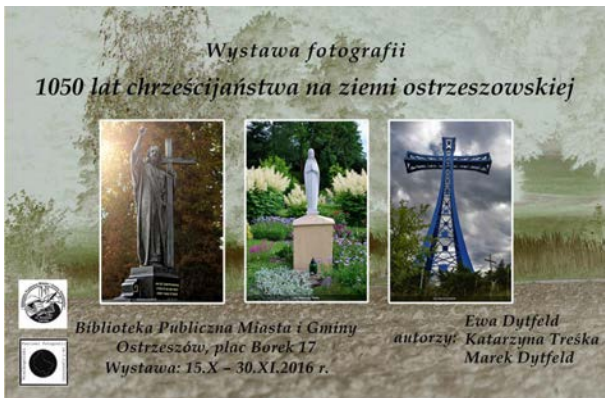
15.10., Biblioteka Publiczna Miasta i Gminy Ostrzeszów im. Stanisława Czernika, „1050 lat chrześcijaństwa na ziemi ostrzeszowskiej”