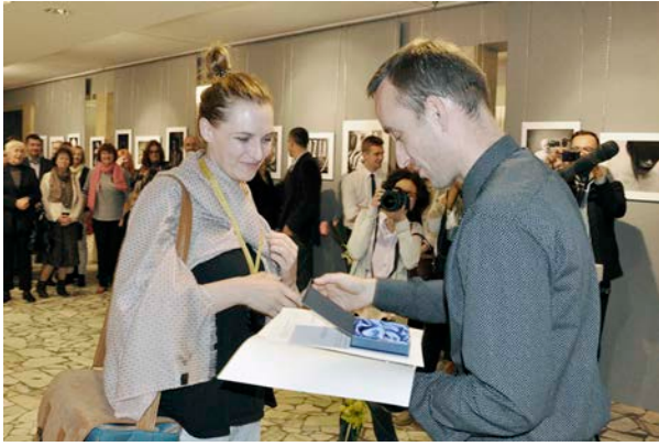
21.10., Nowotomyski Ośrodek Kultury, „Portret Prawdziwy IV”, wystawa pokonkursowa