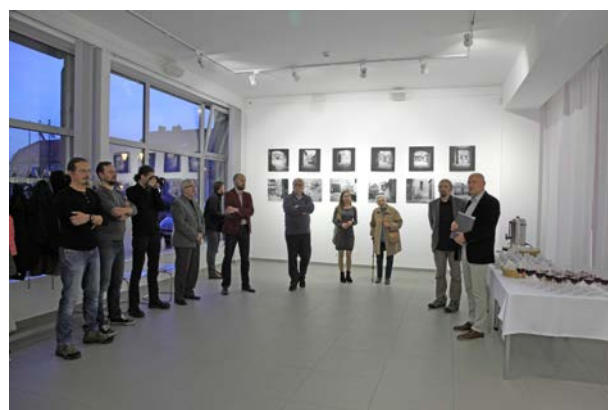
14.10., Galeria Miejska w Środzie Wlkp., Średzkie Towarzystwo Fotograficzne, „Podwórko”