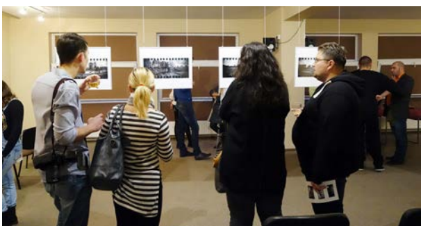
21.10., Wrzesiński Ośrodek Kultury, Klub Moment, „Poczekalnia”