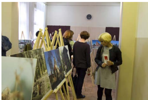
30.09.-30.10., Miejsko-Gminny Ośrodek Kultury w Wyrzysku, „Powiat piłski, jakiego NIE/znamy”