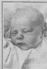
2. Córka państwa Krysiów z Chwaliszewa, ur. 13.12.97 r.