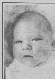
9. Córka państwa Psuików z Starej Huty, ur. 16.12.97 r.