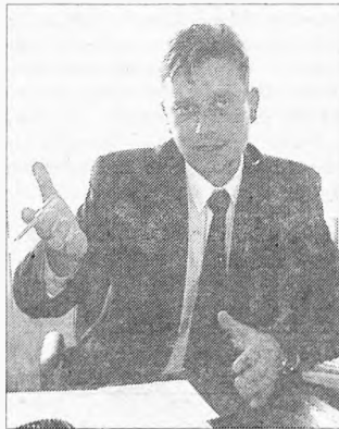
Trzeba pokazać światu, że powiat jarociński jest ciekawym terenem

Niektóre kompetencje mogą się pokrywać. Moim priorytetem jest jednak utrzymywanie dobrych stosunków z poszczególnymi gminami powiatu jarocińskiego. Mam nadzieję, że będziemy się uzupełniać, a nie ścigać się ze sobą. Powiat powinien jednak przyjąć rolę koordynatora.