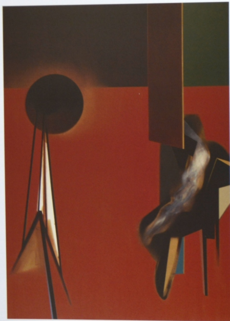
„Medium” z cyklu „Materializacje”, olej na płótnie, 190 x 140 cm