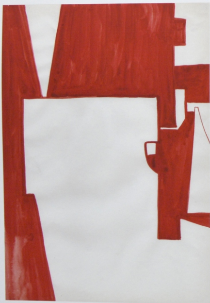
Bez tytułu, akwarela na papierze, 29,7 x 21 cm, 2013