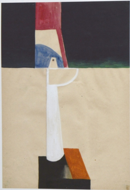
Bez tytułu, gwasz na papierze, 29,7 x 21 cm, 2012