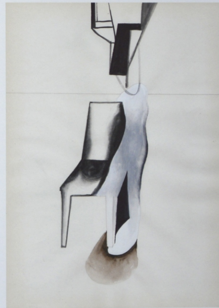
„Widmo”, gwasz na papierze, 29,7 x 21 cm, 2014