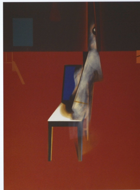
„Widma” z cyklu „Materializacje”, olej na płótnie, 190 x 140 cm