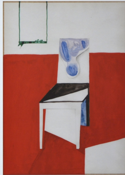
„Materializacje”, gwasz na papierze, 29,7 x 21 cm, 2014