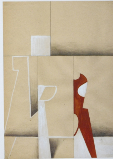
Bez tytułu, gwasz na papierze, 29,7 x 21 cm, 2012