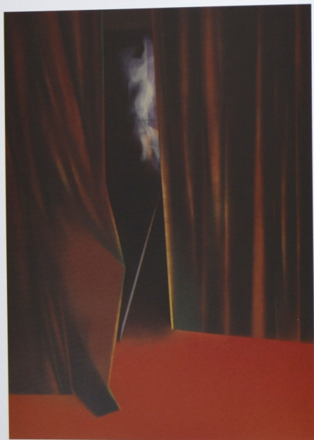
„Zasłona” z cyklu „Materializacje”, olej na płótnie, 190 x 140 cm