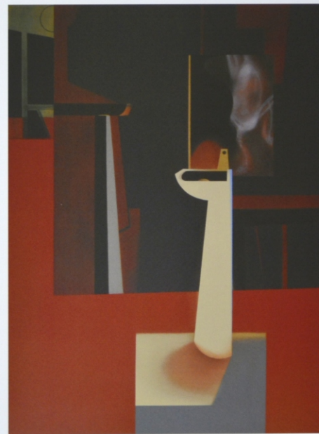
„Preparat” z cyklu „Materializacje”, olej na płótnie, 190 x 140 cm