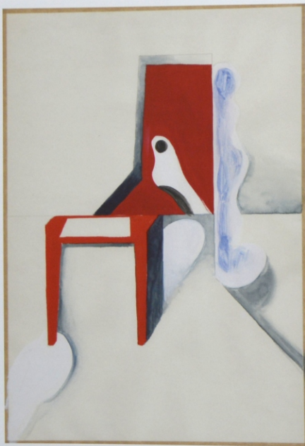
„Materializacja”, gwasz na papierze, 29,7 x 21 cm, 2014