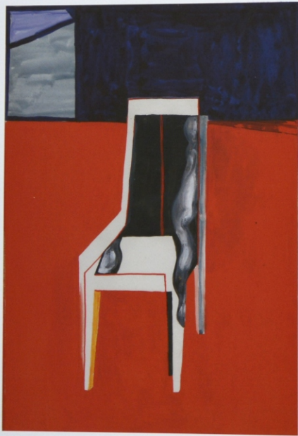
„Materializacje”, gwasz na papierze, 29,7 x 21 cm, 2014