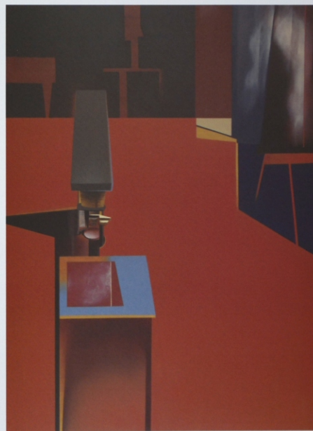
„Powiększenie” z cyklu „Materializacje”, olej na płótnie, 190 x 140 cm