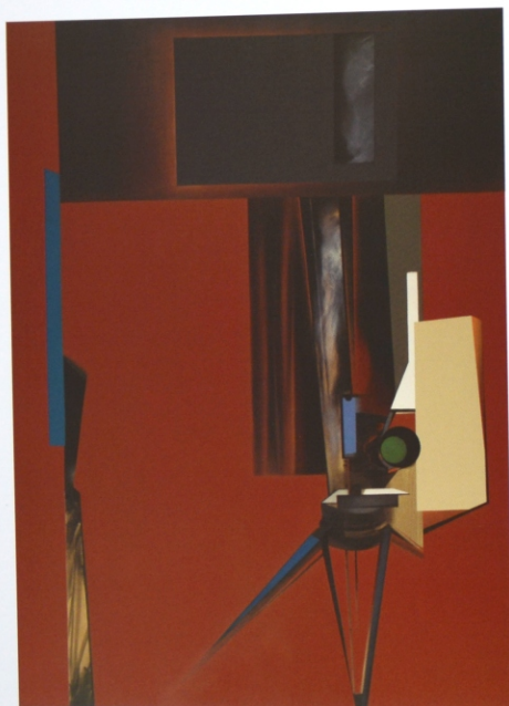
„Projekcja” z cyklu „Materializacje”, olej na płótnie, 190 x 140 cm