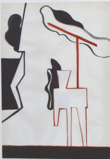
Bez tytułu, akwarela na papierze, 29,7 x 21 cm, 2013