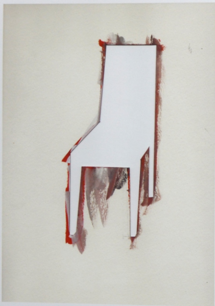
„Widmo”, szablon, gwasz, 32,2 x 23,2 cm, 2014