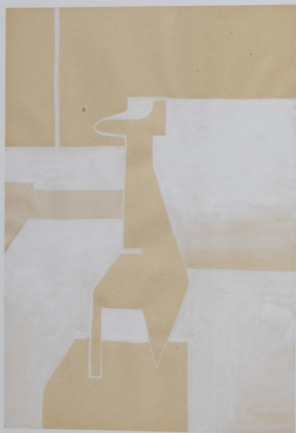
„Nieme znaczenia”, gwasz na papierze, 29,7 x 21 cm, 2012