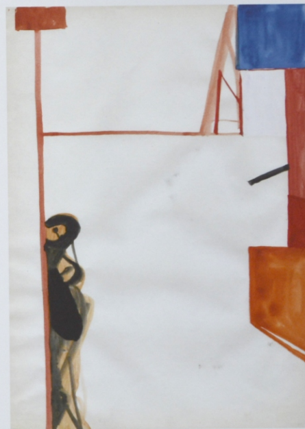
Bez tytułu, akwarela na papierze, 29,7 x 21 cm, 2013