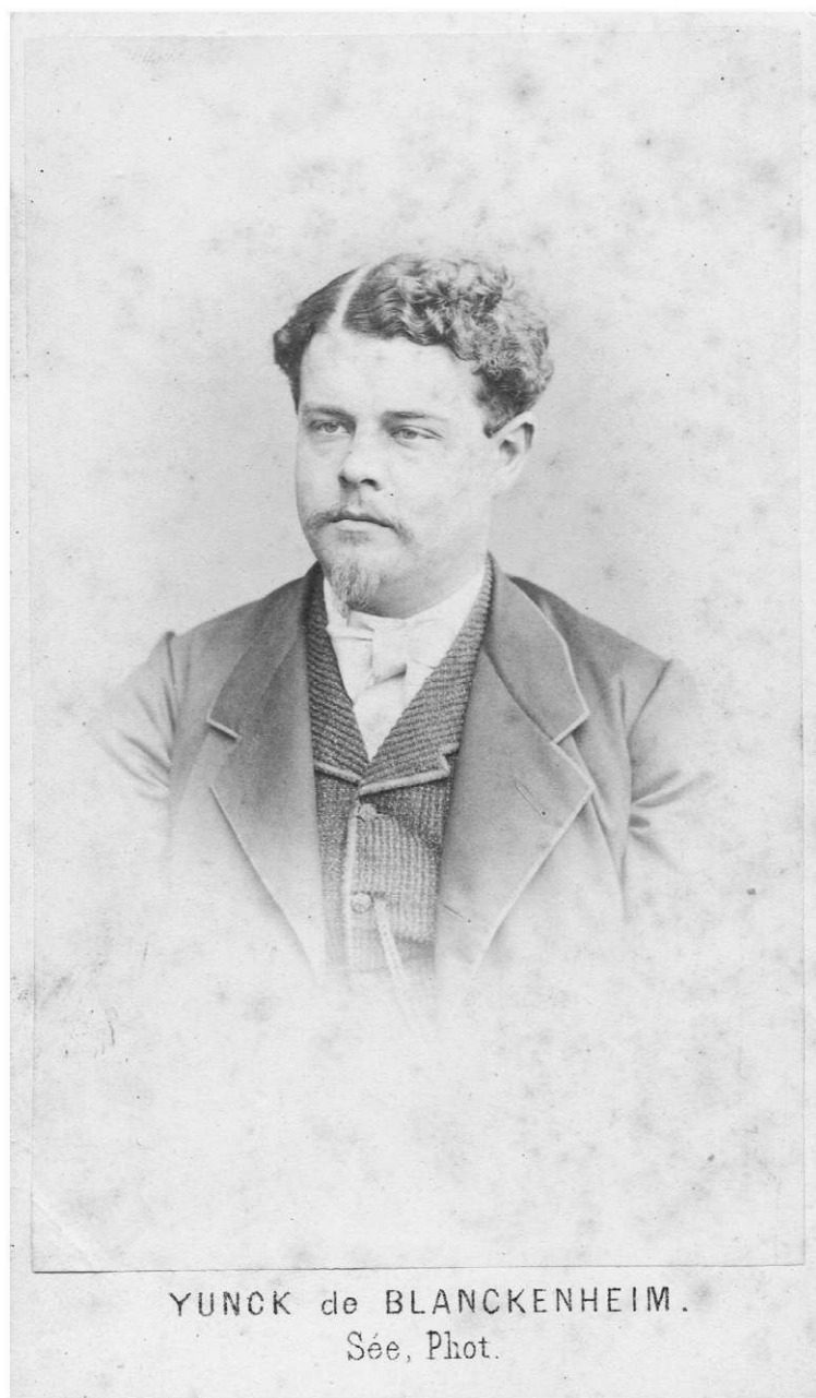
2. Pułkownik Leon Young de Blankenheim, Fot. Zbiory Biblioteki Kórnickiej