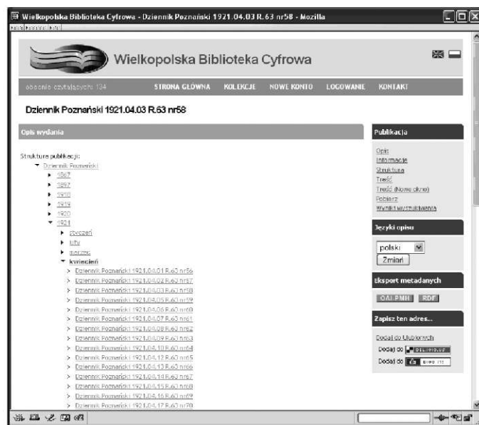
Rys. 3. Przykładowa publikacja grupowa w WBC

danej kolekcji może należeć dowolna liczba publikacji (zbiorów). Dowolna publikacja może należeć do wielu kolekcji, które zazwyczaj tworzone są tematycznie, np. „Dziedzictwo kulturowe”, „Muzykalia”, „Materiały dydaktyczne” itp.