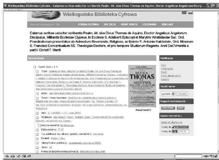
Rys. 2. Przykładowy opis hasłowy publikacji w WBC

Udostępnienie informacji o przechowywanych zasobach za pośrednictwem standardowych metod (takich jak OAI-PMH) umożliwiło szersze wykorzystanie bibliotek cyfrowych, a zarazem zwiększyło dostępność zbiorów będących własnością poszczególnych bibliotek. Dla osiągnięcia efektu wzajemnego przeszukiwania ich zawartości (tj. wymiany danych) każdy zasób cyfrowy oparty o system dLibra jest opisany zestawem metadanych (hasła) (rys. 2). Opis ten może zostać wprowadzony ręcznie lub być zaimportowany automatycznie z plików w formacie MARC, RDF 7 czy XML. Niektóre hasła, jak np. typ zasobu, system wypełnia samoistnie lub też dziedziczy z elementów nadrzędnych. W swojej podstawowej postaci system dLibra oferuje 15 atrybutów zgodnych ze standardem DublinCore w wersji 1.1 8 . Wartości poszczególnych atrybutów są gromadzone w słowniku, wspierającym grupowanie wyrażen o podobnym znaczeniu. Grupowanie to jest następnie wykorzystywane w celu poprawy wyników wyszukiwania. Warto także zaznaczyć, iż każde z hasła może mieć wiele wartości, może zawierać podhasła, a zasób może być w ten sposób opisany w kilku wersjach językowych.