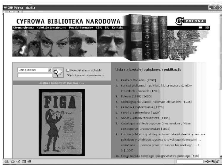
Rys. 1. Przykładowa strona instytucjonalnej biblioteki cyfrowej

Większość bibliotek cyfrowych opartych na oprogramowaniu dLibra widnieje w oficjalnym rejestrze repozytoriów OAI-PMH ( ang. Open Archive Initiative – Protocol for Metadata Harvesting ). 6 Repozytoria te to jedyne oficjalnie zarejestrowane tego typu zbiory zasobów cyfrowych w Polsce. Dzięki stosowaniu otwartego protokołu wymiany metadanych OAI-PMH, zasoby polskich bibliotek cyfrowych mogą być wyszukiwalne w całym Internecie.