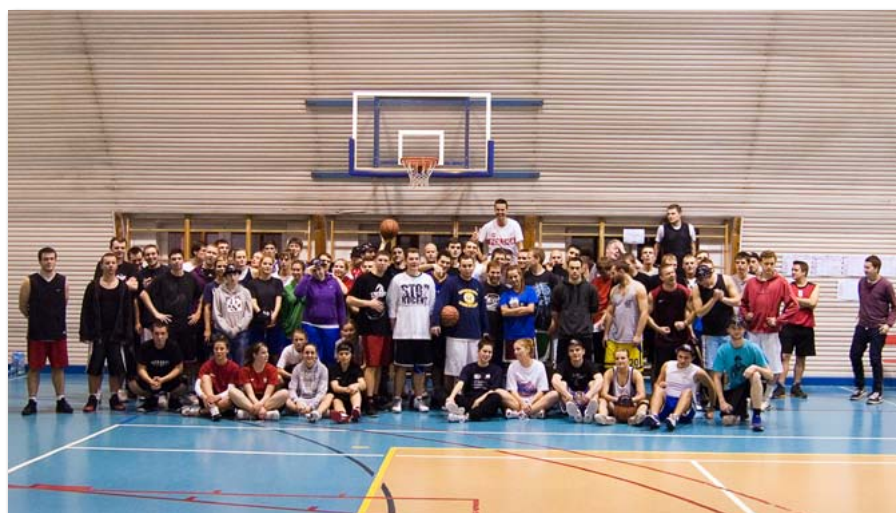
Nocny Turniej Koszykówki