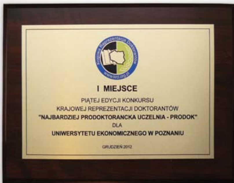
Nagroda za zajęcie I miejsca w Konkursie Krajowej Reprezentacji Doktorantów PRODOK