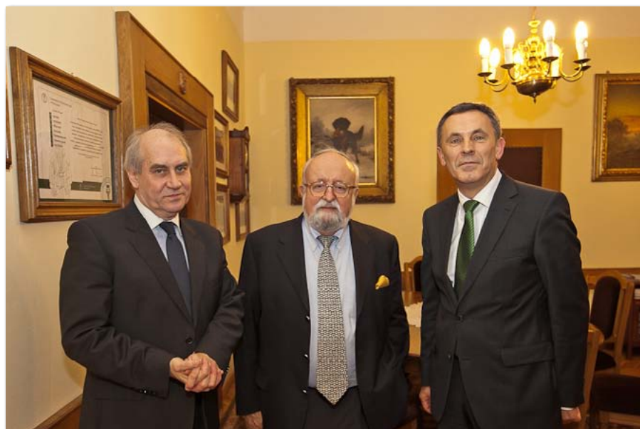
Wizyta prof. Krzysztofa Pendereckiego