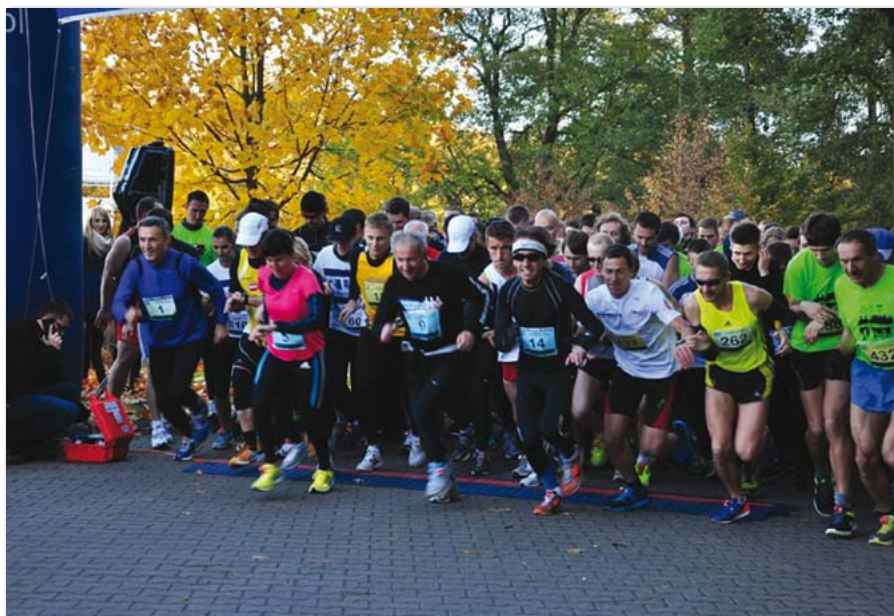
II Akademicki Bieg „Ekonomiczna Piątka”

Nasi studenci reprezentowali UEP również poza granicami Polski. Jak co