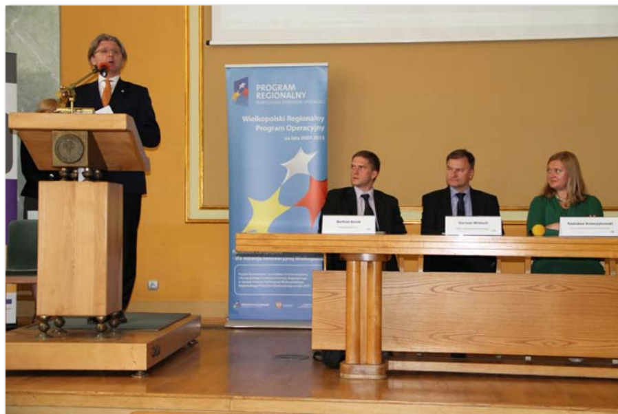
Seminarium pn. „Dzień Dobry Biznes”

W porównaniu z ubiegłym rokiem akademickim spadła liczba organizowanych konferencji naukowych, natomiast wzrosła ich ranga, gdyż coraz więcej konferencji zorganizowanych przez pracowników UEP miało charakter międzynarodowy. Wykaz wybranych konferencji przedstawia tabela 18. Warto również wspomnieć, że ubiegły rok obfitował w wiele ciekawych i ważnych, nie tylko z ekonomicznego punktu widzenia, wykładów, a nasza Uczelnia gościła wybitne osobistości między innymi ze świata nauki, ekonomii i muzyki.