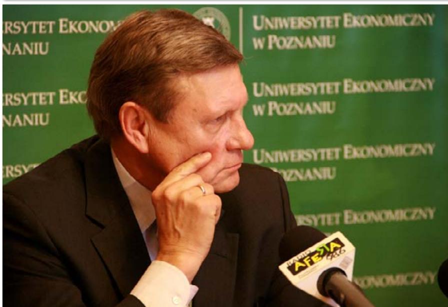
Wizyta prof. Leszka Balcerowicza