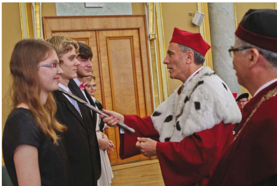
Inauguracja roku akademickiego 2012/2013

rektorów wybranych na kadencję 2012–2016; • z dniem 30 września 2012 roku została zlikwidowana Katedra Usług na Wydziale Zarządzania, a jej dotychczasowa działalność naukową i dydaktyczną oraz majątek, a także pracowników włączono do Katedry Badań Marketingowych na tym Wydziale;