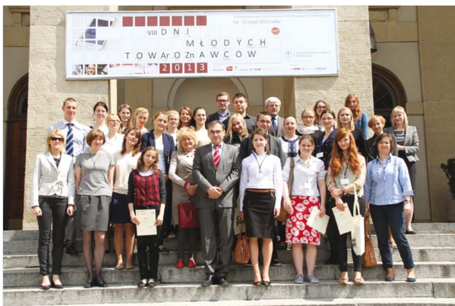
Uczestnicy VIII Dni Młodych Towaroznawców