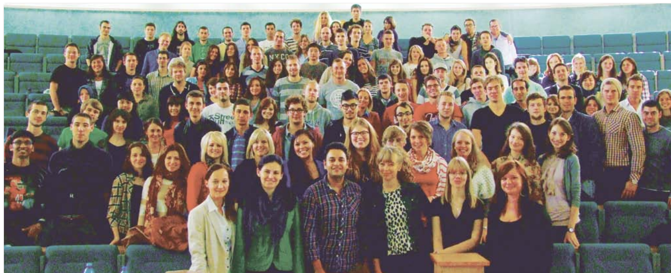
Powitanie studentów zagranicznych studiujących na UEP w ramach programu Erasmus i umów bilateralnych

* 1 student studiował zarówno w ramach programu Erasmus, jak i umowy międzyuczelnianej