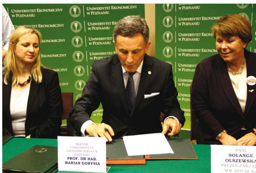
Podpisanie porozumienia o przystąpieniu do Klubu Partnera UEP przez Jeronimo Martins Polska S.A. oraz Solaris Bus & Coach S.A.

W temacie dotyczącym „Długoterminowej strategii zarządzania wizerunkiem pracodawcy Volkswagen Poznań – Fabryka Samochodów Użytkowych”