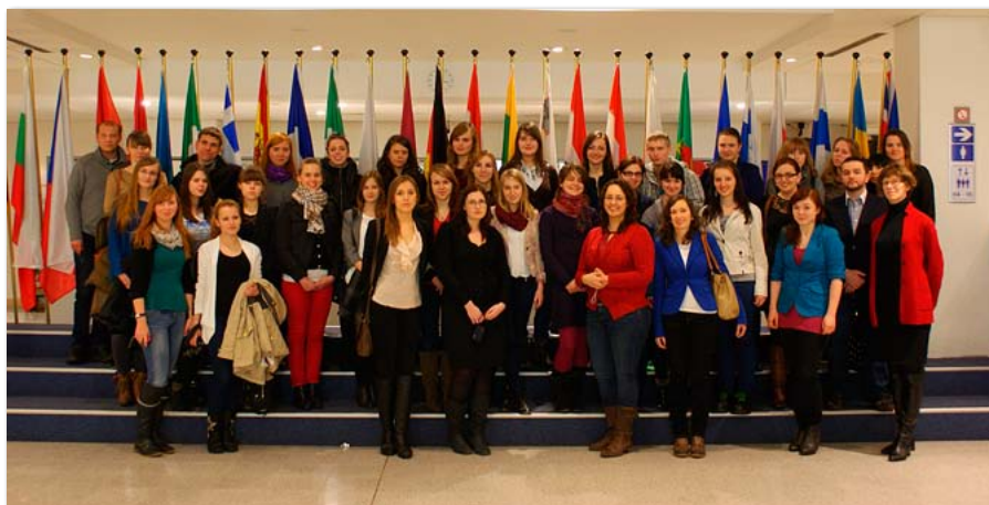
Uczestnicy wyjazdu studyjnego SKN EEurope do Brukseli i Luksemburga

Na uwagę zasługuje VIII Międzynarodowe Forum Studenckich Kół Naukowych Towaroznawstwa, które odbyło się 15 maja 2013 roku. Udział w nim wzięli studenci zarówno z krajowych,