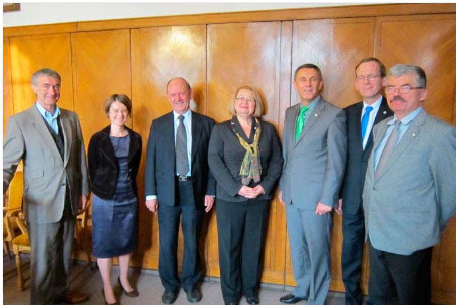
Członkowie Komisji Akredytacyjnej Międzynarodowego Stowarzyszenia CEEMAN z przedstawicielami UEP

Uniwersytet Ekonomiczny w Poznaniu zajął drugie miejsce – po Szkole Głównej Handlowej w Warszawie – w konkursie na najbardziej medialną uczelnię ekonomiczną w kraju – według analizy „PRESS-SERVICE Monitoring Mediów”. Świadczy to o prestiżu naszej Uczelni, która wielokrotnie, przy najróżniejszych okazjach, jest przywoływana w środkach masowego przekazu. Dziennikarze piszą zarówno o działalności edukacyjnej, aktywności naukowej, prowadzonych inwestycjach Uniwersytetu Ekonomicznego w Poznaniu, jak i pojawiają się artykuły z życia i działalności kulturalno-sportowej naszych studentów.