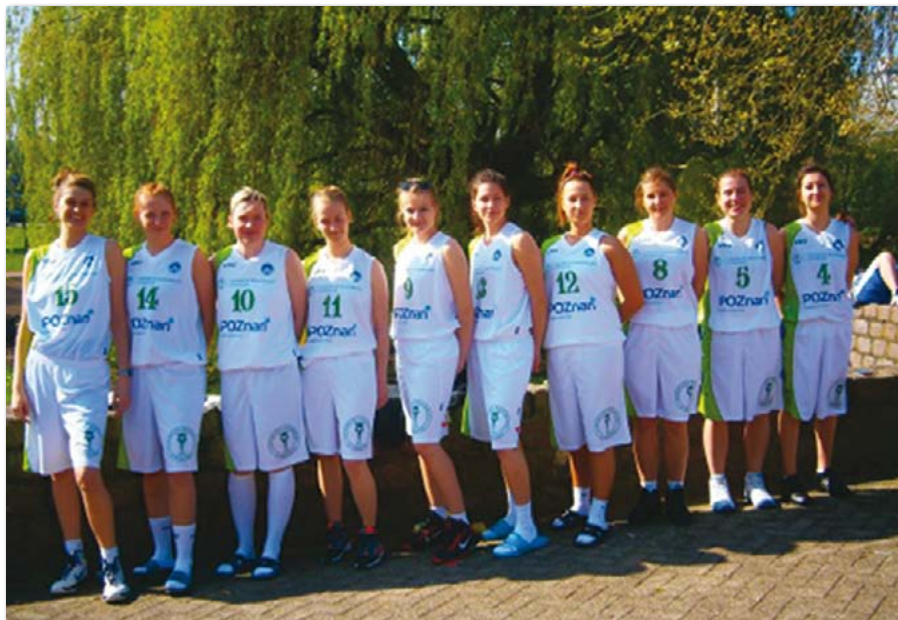
Sekcja Koszykówki Kobiet UEP

roku startowali w zawodach w Londynie – sztafeta w Hyde Parku. Uczestniczyli także w turniejach tenisa stołowego