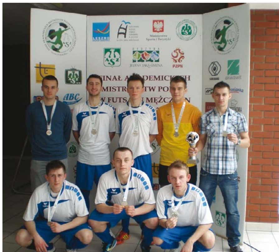
Drużyna UEP w finale Akademickich Mistrzostw Polski w Futsalu Mężczyzn

Rok akademicki 2012/2013 był szczególnie pod względem organizacji zawo-