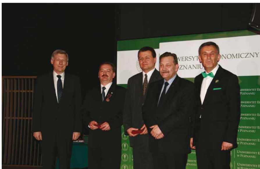
Gala V Dni Uniwersytetu Ekonomicznego w Poznaniu

V DNI UEP zakończyły się uroczystą Galą, która tym razem odbyła się w Teatrze Nowym w Poznaniu. Podczas Gali zasłużonym pracownikom Uczelni zostały wręczone ordery i odznaczenia państwowe, a także Medale Komisji Edukacji Narodowej. Ponadto decyzją Kapituły Medale „Za Zasługi dla Uniwersytetu Ekonomicznego w Poznaniu” przyznano: Markowi Woźniakowi – Marszałkowi Województwa Wielko-