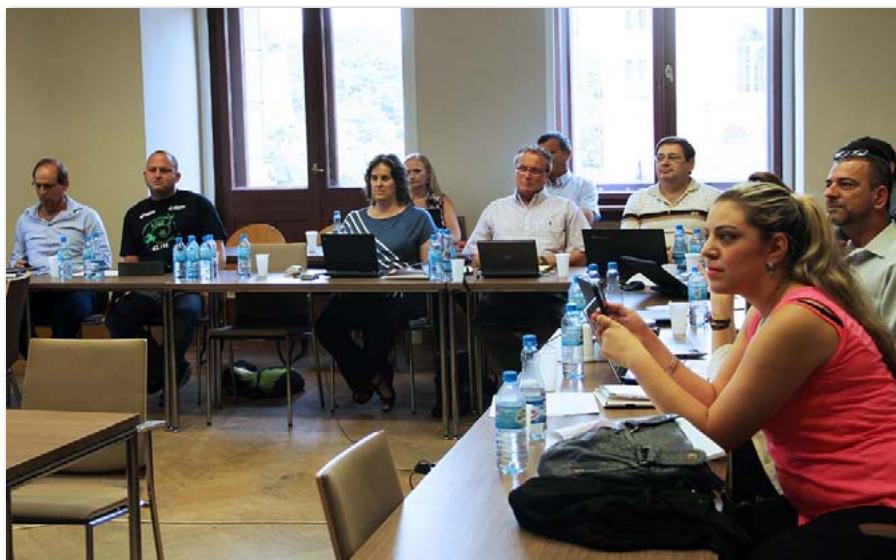
Warsztaty uczestników II edycji izraelskiej Doctoral Seminars in English