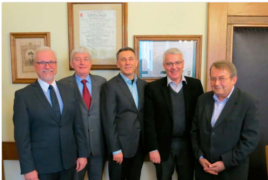
Uczestnicy Konferencji Rektorów Uczelni Ekonomicznych na UEP