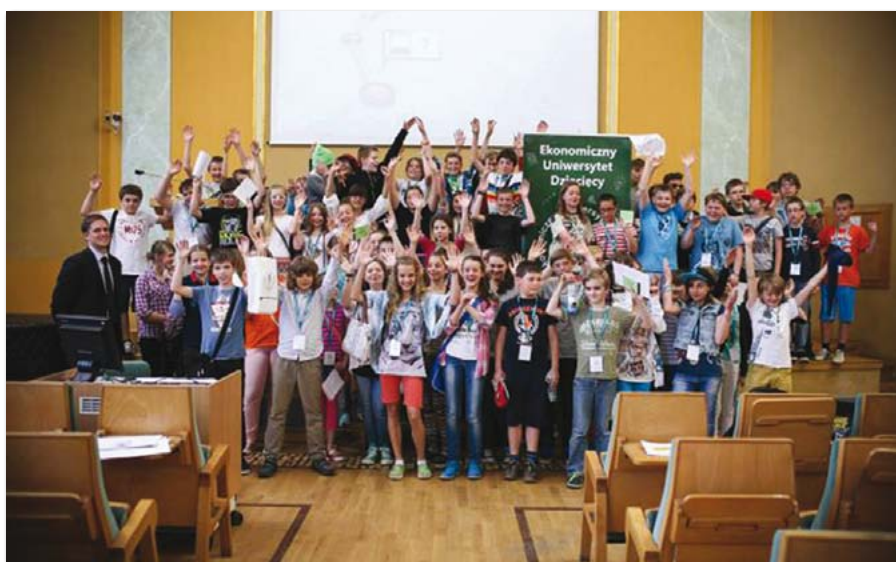
Uczestnicy Ekonomicznego Uniwersytetu Dziecięcego

torem i organizatorem wielu przedsięwzięć szkoleniowych. W roku akademickim 2012/2013 najistotniejszymi zadaniami wykonanymi przez BKU były: