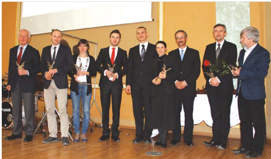
Laureaci konkursu VICTORIE 2013