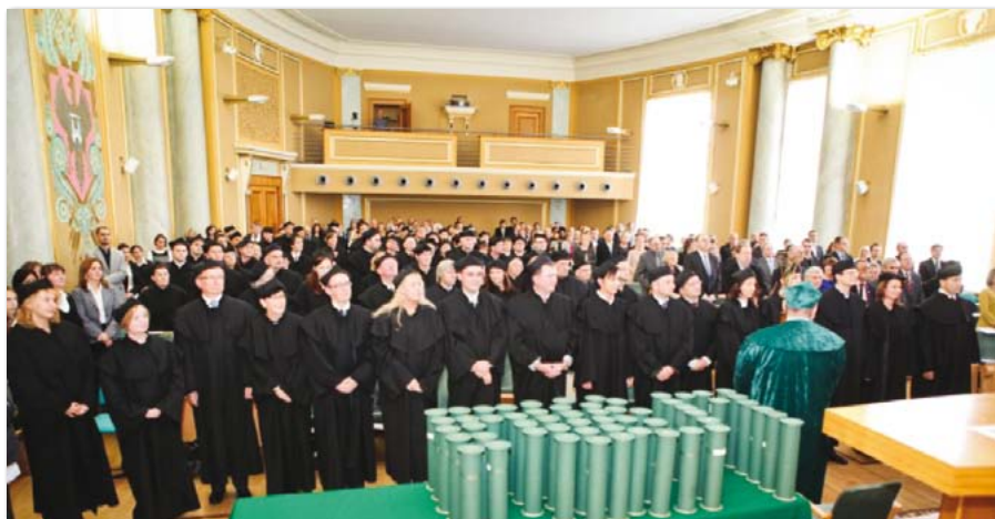
Uroczyste promocje doktorów i doktorów habilitowanych na UEP

Istotną rolę w uzupełnieniu oferty edukacyjnej Uniwersytetu Ekonomicznego w Poznaniu odgrywają studia podyplomowe. Nad całością działań związanych z koordynacją oferty studiów podyplomowych czuwało Biuro Kształcenia Ustawicznego, które było inicja-