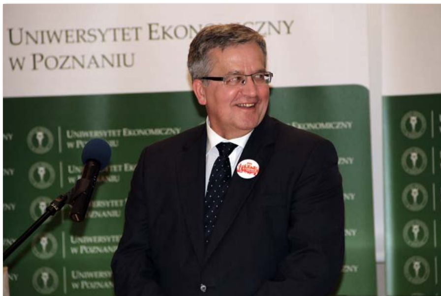
Wizyta Prezydenta Rzeczypospolitej Polskiej Bronisława Komorowskiego