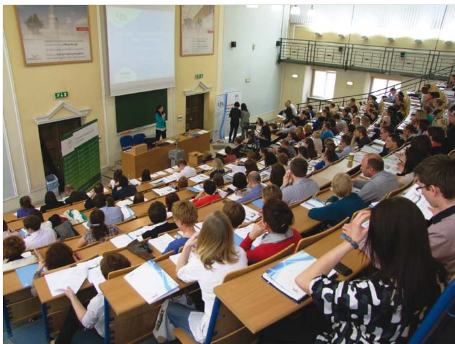
Seminarium pt. „Programy Narodowego Centrum Badań i Rozwoju”

Spotkania cieszyły się dużym zainteresowaniem, także wśród gości spoza Uczelni. Zostały bardzo pozytywnie ocenione przez uczestników, dzięki czemu można spodziewać się kolejnych tego typu wydarzeń. Wymiernym efektem udziału w spotkaniach i wzmożonej aktywności kadry Uczelni w zakresie udziału w konkursach i projektach, poza wzrostem liczby wniosków składanych w licznych konkursach, jest udział pracowników w programie TOP 500 Innovators Science Management – Commercialization i 2-miesięczne stażo-szkolenie praktyczne dotyczące komercjalizacji wyników badań naukowych na Uniwersytecie Kalifornijskim w Berkeley oraz w największych firmach mają-