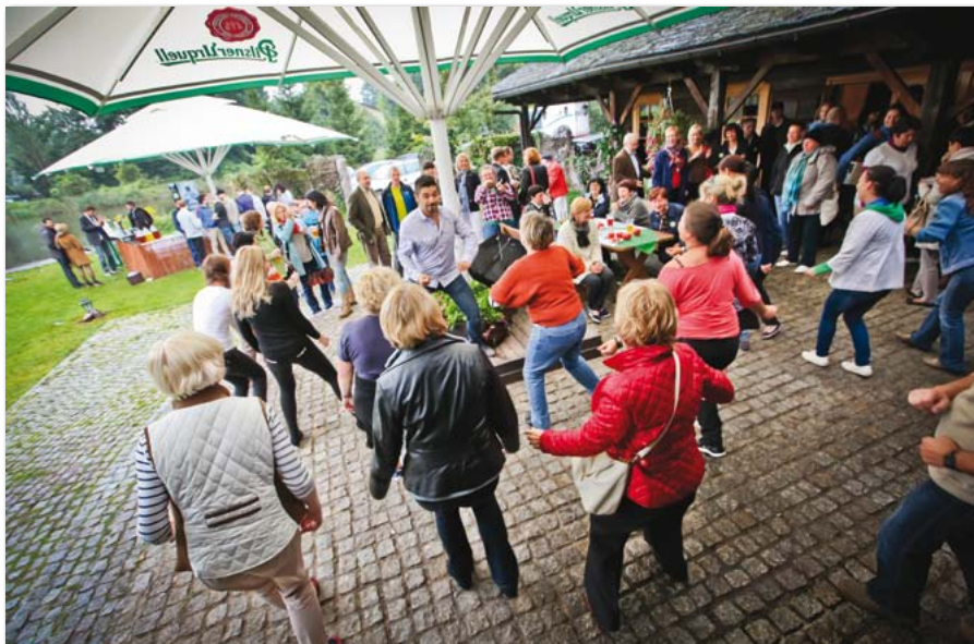
Piknik pracowników UEP

28 września 2012 roku Uniwersytet Ekonomiczny w Poznaniu zainaugurował 87. rok swojej działalności. Uroczystą inaugurację nowego roku akademickiego poprzedziło wmurowanie kamienia węgielnego pod budowę nowego gmachu dydaktycznego Uczelni pod nazwą Centrum Edukacyjne Usług Elektronicznych. W uroczystości wzięli