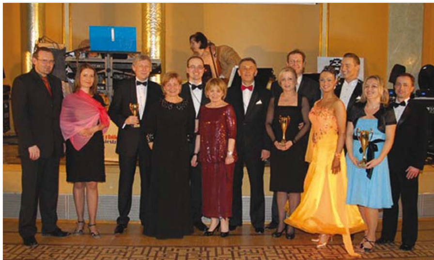
Bal Seledynowy 2013

Uczelni miał miejsce Bal Seledynowy. XIX edycja Balu odbyła się tym razem w konwencji Iwowskiej. Organizatorami tej prestiżowej imprezy byli: Uniwersytet Ekonomiczny w Poznaniu, Korporacja LECHIA oraz Fundacja Akademicka Gaudeamus Igitur.