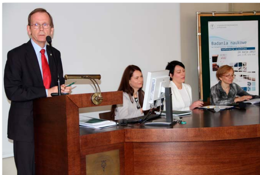
Konferencja pt. „Badania naukowe na Uniwersytecie Ekonomicznym w Poznaniu”

W minionym roku akademickim Centrum Statystyki Regionalnej wraz z Urzędem Statystycznym w Poznaniu reprezentowali polską statystykę publiczną