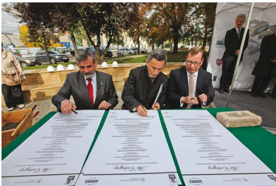
Podpisanie aktu erekcyjnego pod budowę Centrum Edukacyjne Usług Elektronicznych

Uniwersytet Ekonomiczny w Poznaniu został nagrodzony 3 palmami w kategorii Excellent Business Schools w rankingu 1000 najlepszych uniwersytetów i szkół biznesu na świecie. To ogromny sukces i wielkie wyróżnienie, które świadczy o mocnej pozycji naszej Uczelni, również na arenie międzynarodowej. Tą prestiżową nagrodą w rankingu 1000 najlepszych uniwersytetów i szkół biznesu na świecie Uczelnia została wyróżniona podczas V Światowej Konwencji Eduviversal w Limie (Peru). Uniwersytet Ekonomiczny w Poznaniu zajmuje wysokie miejsca w zestawieniach Eduviversal już od chwili powstania rankingu, czyli od 2008 roku.