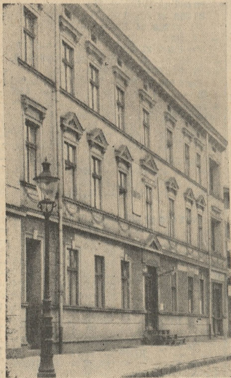
Dom K. T. O. K. przy ul. Marsz. Focha 21.