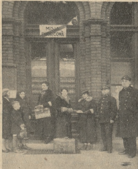
Przy Misji Dworcowej na I peronie.

W zakładzie wszędzie czysto i schludnie. Każdy kącik umiejętnie