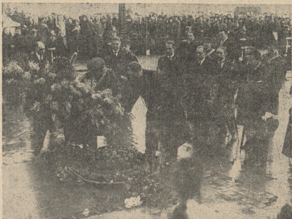
W drodze powrotnej z uroczystości żałobnych w Londynie przybył do Paryża król Karol rumuński, aby wziąć udział w ważnych naradach politycznych z prezydentem Lebrunem i premierem Sarraut. Na zdjęciu król Karol składa wieniec na grobie Nieznanego Żołnierza.