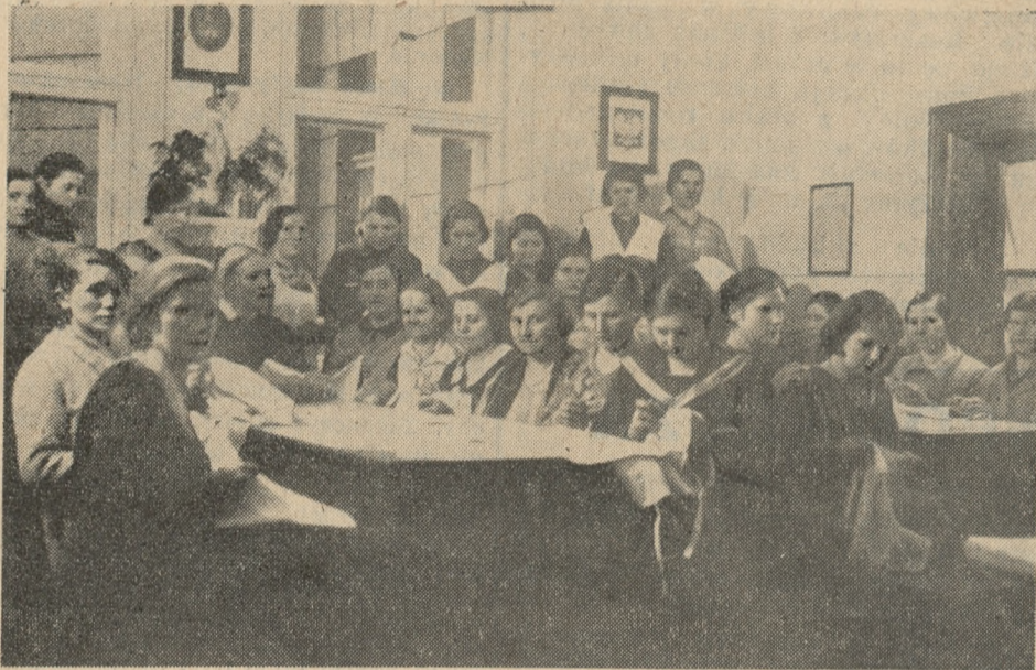
Dziewczęta w Świetlicy Schroniska zajęte pracą.

sposobność zapoznania się z tą dotąd zupełnie mi obcą organizacją. Jako człowiek szczerze zainteresowany wszelkimi zagadnieniami potrzeb i nędzy chwili obecnej, uczyniłem szczegółowy wgląd w życie i działalność K. T. O. K. mającą na celu opiekę nad młodą kobietą.