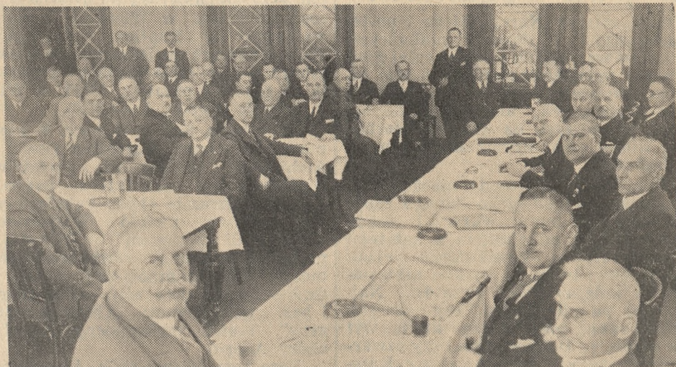
Wczoraj obradowały w Poznaniu delegacje bractw kurkowych z całej Polski

Uchwalono regulamin dla rad honorowych w okręgach i Zjednoczeniu, oraz dla sądów honorowych w bractwach. Również uchwalono regulamin strzelniczy obowiązujący przy strzelaniach okręgowych i kongresowych w całym Zjednoczeniu Kurkowych Bractw Strzeleckich. Ponadto