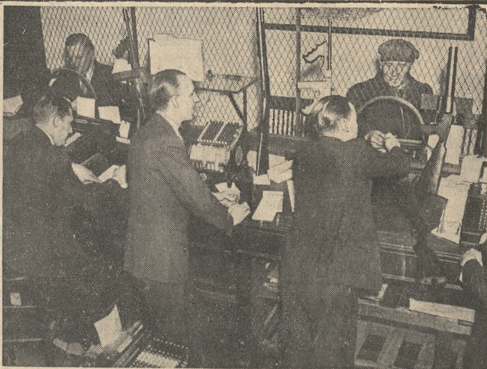
Mimo wysiłku policji, a specjalnie G-menów, gangsterzy amerykańscy nadal pracują. Banki więc, aby się obroniły przed napadami, zaopatrzyły swych kasjerów w karabiny maszynowe.