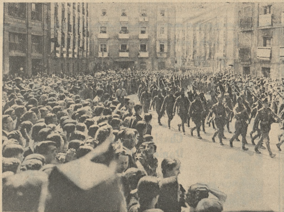
W Burgos, siedzibie hiszpańskiego rządu narodowego, powitano owacyjnie oddziały wojsk powstańczych wracające z frontu.