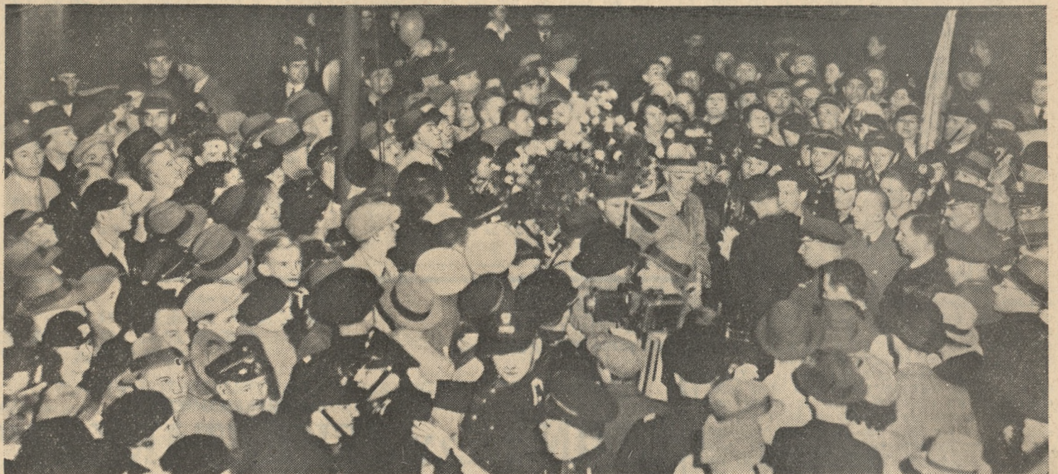
Tłumy witają kpt. Janusza i por. Brenka podczas przyjazdu we wtorek wieczorem na warszawski dworzec wschodni. Dzielnych lotników widzimy w środku w chwili przemawiania do mikrofonu.