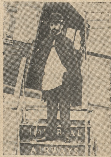
Jak już donosiliśmy, negus Haile Selassie przyleciał samolotem z Londynu do Genewy.