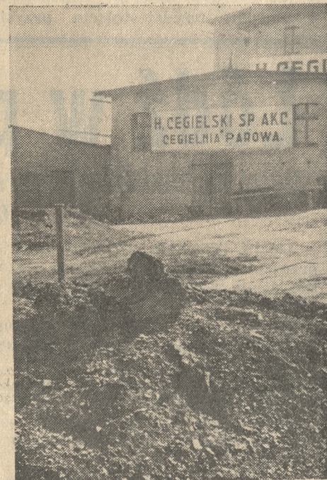
Wydobyty węgiel z nowego pokładu na terenie firmy H. Cegielski.

— Dnia 21 b. m. na placu Sapiieżyńskim płacono (w złotych za 100 kg wagi, za sztukę): Nabiał: masło wiejskie 1,20—1,30, masło mlecz. 1,30—1,40, twaróg 0,20—0,25, smietana (litry) 1,00—1,20, mleko (litry) 0,17—0,20, jaja mendeł 1,00—1,10. Drob i dziczyzna: kura 1,60—2,30, kaczka 1,60—2,50, geś 2,50—3,50, gołębie (para) 0,60—0,90, para kurczak 1,50—3,40, para kurpaw 0,80—1,20, królik — 0,90—1,20. Mięso: wieprzowina 0,70—1,00, wołowina