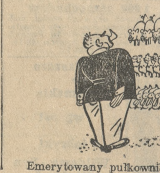
Emerytowany pułkownik jako hodowca świń i drobiu.

Dziewczyna samodzielne gotowanie od zaraz. Chwaliszewo 76, m. 17. zdg 94 231