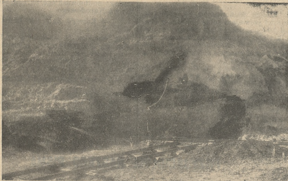
Czarne plamy na zdjęciu oznaczają pokład węgla w górze.

Chodzież (mc) Wielkie zainteresowanie wzbudziła tutaj wiadomość o odkryciu przy wydobywaniu gliny do ka gliniastej góry, do niezbadanej do- tąd głębokości. Wprawdzie wydobyty dotąd węgiel