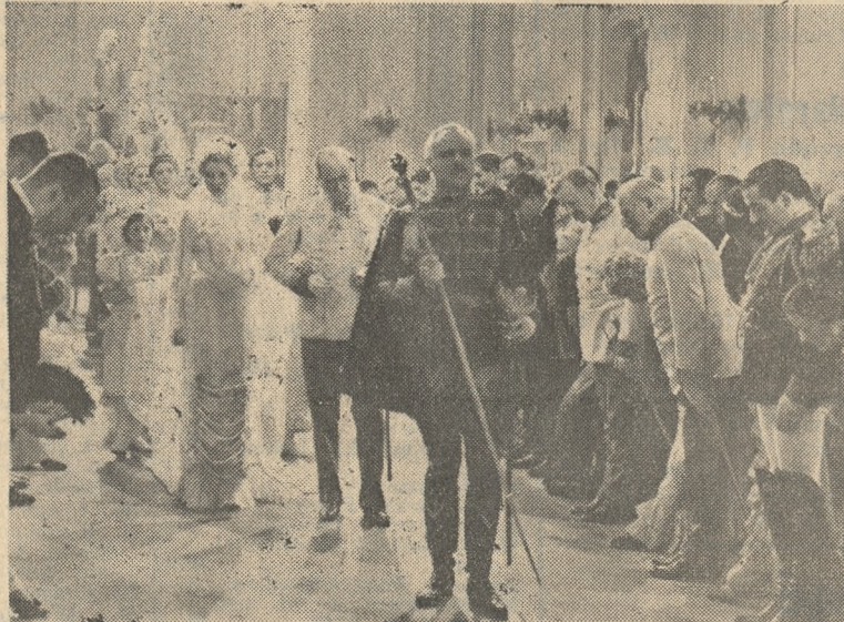
Efektowna scena z najpiękniejszego filmu miłosnego p. t.: „MAYERLING“, którego premiera oczekiwana jest oddawna z niebywałym zainteresowaniem. W milionowym tem arcydziele rolę główne kreują: Charles Boyer i Danielle Darrieux.

Buława ta obita jest 18 złotymi lwami a szczyt jej uwieńczony jest złotą koroną z liści róży, pokrzywy i koniczyzny — emblematami Anglii, Szkocji i Irlandji — a oprócz tego małym posążkiem pogromcy