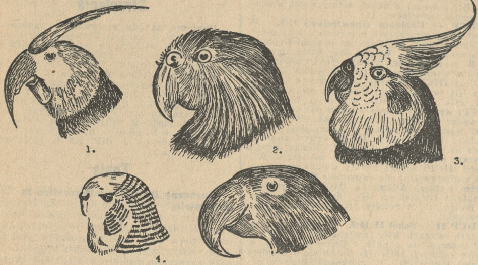
Kształty dziobów papuzich. 1. u Arakakadu, 2. u Kakapo, 3. u nimfy, 4. u papużki przegowanej i 5. u Ary hiacyntowej.

Na gniazda wybierają sobie niektóre gatunki naturalne dziuple w drzewach, lub też dziuple innych ptaków — a nieraz budują je sobie same. Inne znów