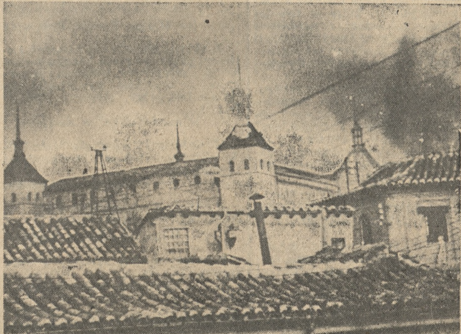
Alkazar w Toledo, broniony bohatercko przez garstkę powstańców, w płomieniach

Obstrukcję usuwają Ziela Przerzycrajace Karpiańskiego Paczka ul. 150, cokolka 25 groszy