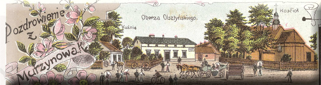
Źródło: Poczta. Pozdrowienie z Murzynowa K. Format: 9 x 14 cm. Wydawca: Postkartenspezialfabrik A. Rademacher. Breslau. Ok. 1907.