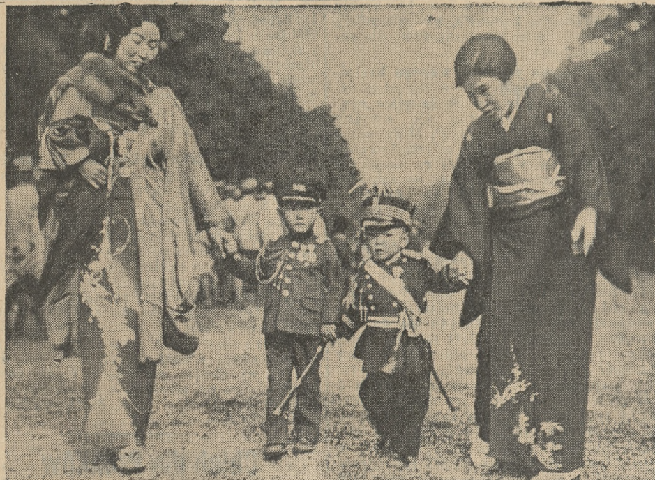
Młode księżątka japońskie, prowadzone za rączkę przez mamusie, udają się z okazji uroczystości narodowej Shishigosan do świątyni.

ryskiego Luwru zapłaciła olbrzymią kwotę czterystu tysięcy franków i którą oglądali i podziwiali eksperci całego świata, uznając ją za bezspornie autentyczne dzieło wielkiego mistrza czwartego wieku. O fakcie szalbierstwa dali się ci „znawcy” dopiero wówczas przekonać, kiedy twórca