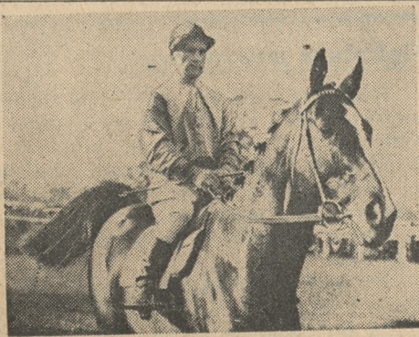
Znakomity jeździec angielski Gordon Richards zdobył po raz dziesiąty mistrzostwo Anglii w gonitwie płaskiej.

Znany amerykański przemysłowiec filmowy, twórca dźwiękowych tygodników aktualności William Fox, skazany został przez sąd w Kalifornii za lekkomyślne zaciąganie i systematyczne nieplacenie długów na karę kilkotygodniowego aresztu. Fox mimo kilkakrotnych wezwań do odbycia kary nie stawiał się. Obecnie władze sądowe wydały nakaz aresztowania go przy pierwszej nadarzającej się sposobności. Fox poinformowany o decyzji kalifornijskich władz sądowych, ułotnił się. Obecnie policja kalifornijska czeka na chwilę pojawienia się przemysłowca w Hollywood, by dokonać aresztowania. Fox prawdopodobnie nie rychło pojawi się w stolicy filmu.