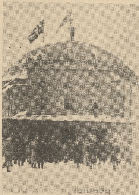
Gmach kina Colosseum na chwilę przed zawodami

(Od specjalnego wysłannika „Kuriera Poznańskiego“)