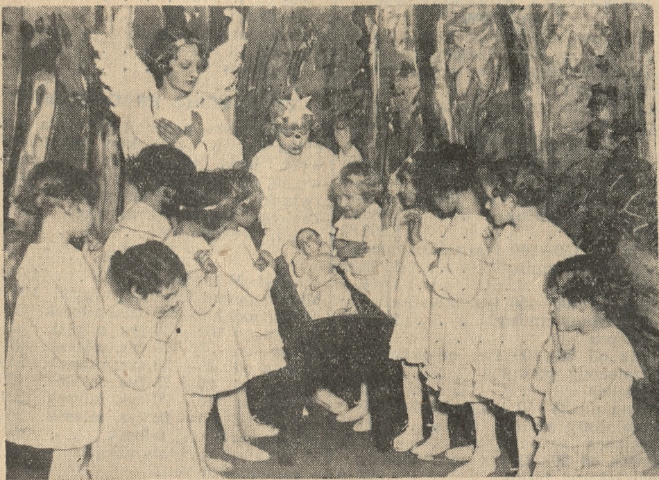
Piękna scena zbiorowa przy żłóbku.

Interesujący program, dobre, jak na dzieci, gra, śpiewy i popisy taneczne, piękne, do każdego występu inne.