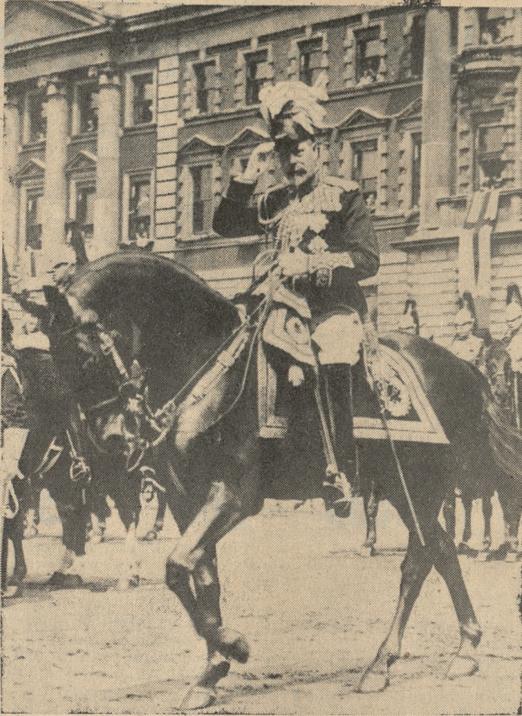
Król Jerzy V. podczas jednej z parad wojskowych. Szczegóły o chorobie króla na stronie 2-giej.