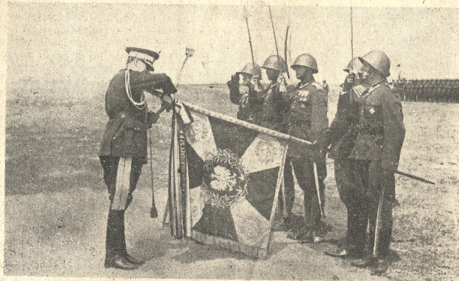
Król Karol dekoruje orderem Michała Walecznego chorągiew 57 p. p.

Przez błonia przelatuje okrzyk żołnierzy pułku: