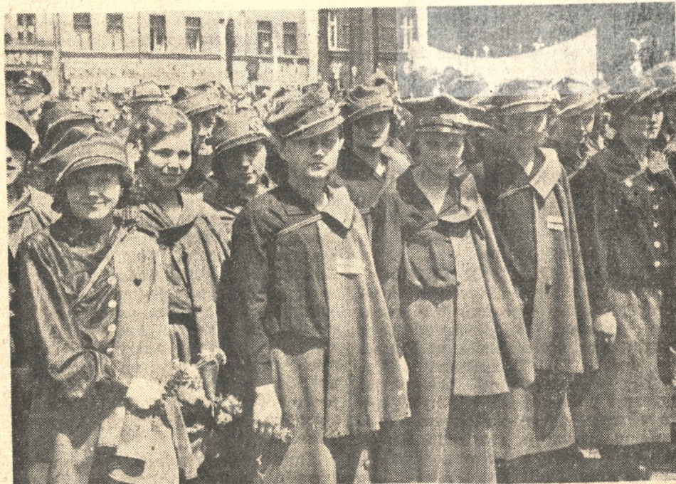
Na katowicki zlot Sokoła przybyły licznie Sokolice czeskie. Zdjęcie przedstawia druhy z Czechosłowacji na rynku w Katowicach.