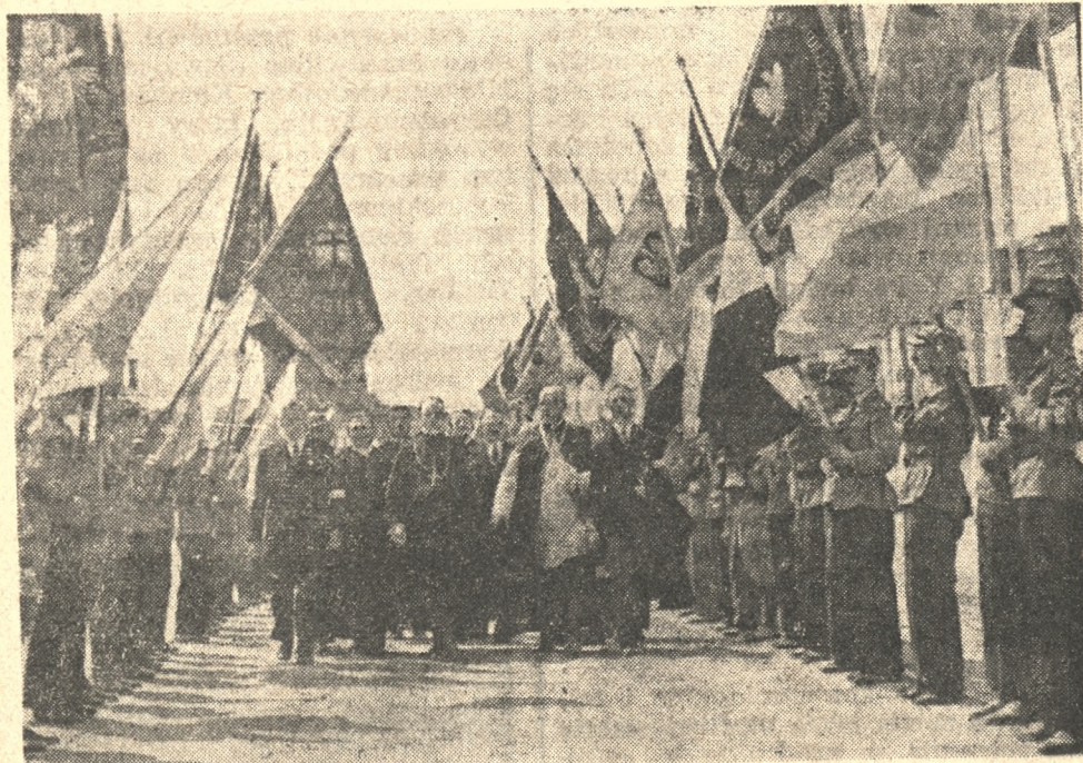
Prezydium Zjazdu K. S. M. M. przechodzi przez spacer sztandarów Stowarzyszenia.

Wczoraj o godz. 15,30 na placu św. Marka, na terenie Targów Poznańskich, odbyło się jubileuszowe zebranie zlotowe stowarzyszenia.