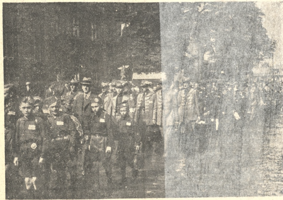
Każdy przybywający do Katowic pociąg przywoził setki Sokółów, którzy następnie w szeregach szli przez miasto do swych kwater. Na zdjęciu Sokoli z Poznania.