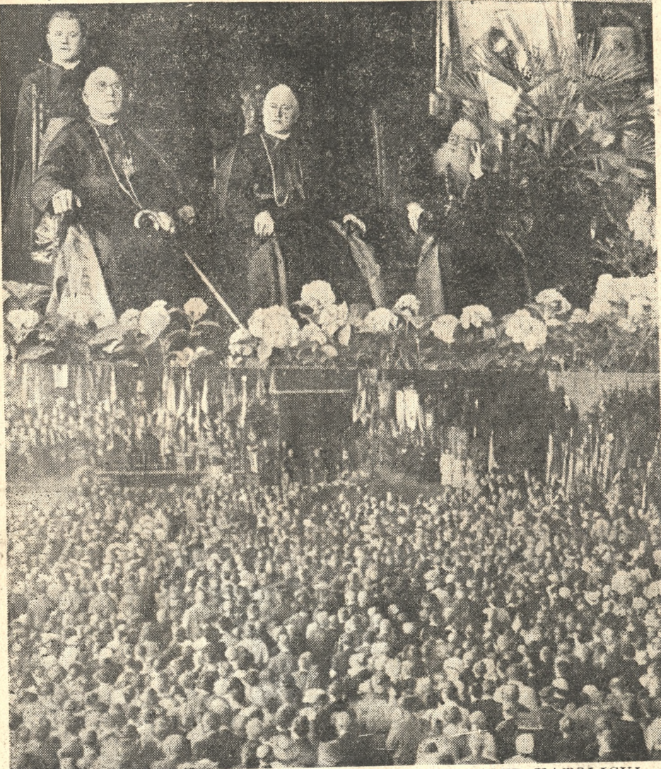
WCZORAJ OBRADOWAŁ W POZNANIU XVII ZJAZD KATOLICKI.

1) stanęło jak najliczniej w szeregach stowarzyszeń Akcji Katolickiej celem wyrobienia w nich ludzi oży-