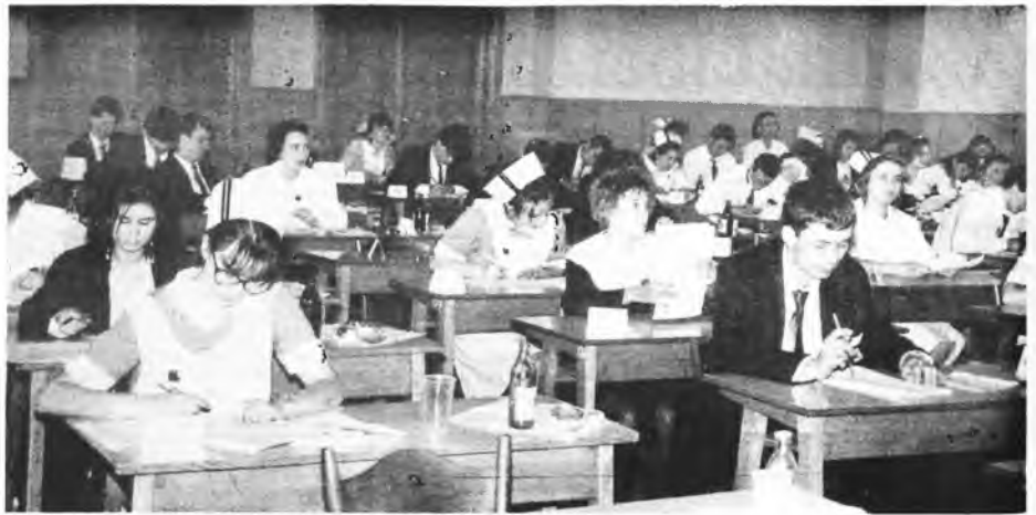
Matura w Zespole Szkół Zawodowych Nr 1.

W Liceum Ogólnokształcącym w Jarocinie chęć przystąpienia do matury zgłosili wszyscy absolwenci, tj. 182 uczniów. Jedna osoba nie stała się jednak na egzamin dojrzałości. Już po raz trzeci absolwenci liceum pisali maturę w swojej sali gimnastycznej. Tradycyjnie, w pierwszy dzień matur, młodzież musiała się wykazać wiedzą i znajomością