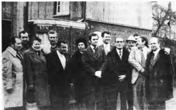
Delegacja Jarocina podczas pierwszej wizyty w Libercourt przed domem, w którym mieszkał Edward Gierek.

Dopiero po siedmiu miesiącach przyszła odpowiedź na moje wystąpienie o zgodę na nawiązanie kontaktów z Libercourt. Pod koniec sie-