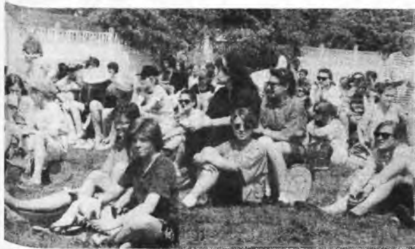
Występy zespołów cieszyły się dużym zainteresowaniem...

Gminy w Nowym Mieście. Majówka trwała do późnego wieczora, zwiedzano okolice Dębna, występowały zespoły muzyczne i folklorystyczny, odbyły się konkursy. Cel rajdu i majówki - zbliżenie do mieszkańców Domu Wzajemnej Pomocy, ukazanie ich problemów - z pewnością został spełniony.