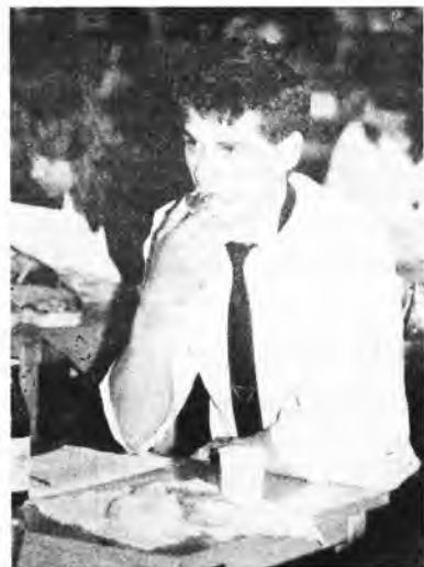
„Gdy w brzuchu pusto w głowie groch z kapustą”

wsza - powiedział J. Śmiłowski. - Jestem zdecydowanym przeciwnikiem strajku podczas matur. Powoduje to dodatkowy stres wśród uczniów przed pierwszym w życiu tak ważnym egzaminem.