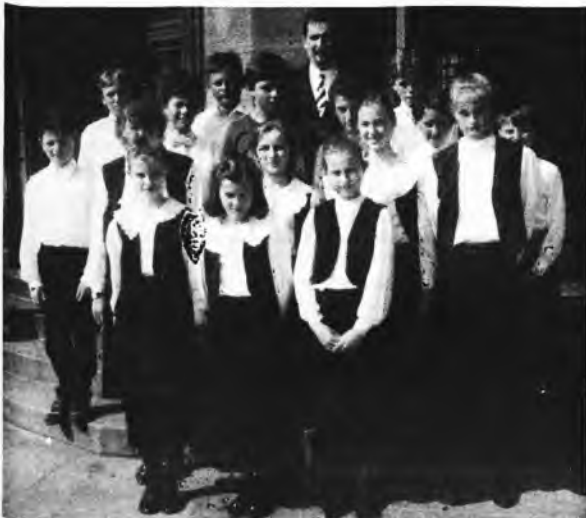
Młodzi akordeoniści z Kotliny