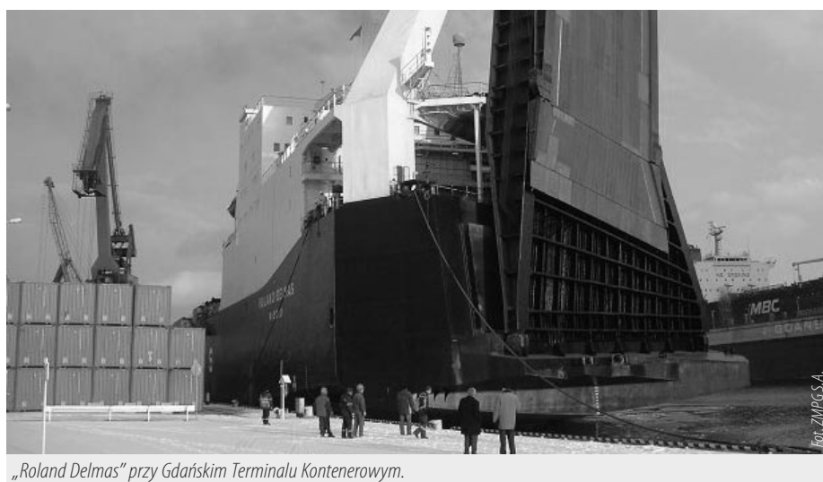
„Roland Delmas” przy Gdańskim Terminalu Kontenerowym.