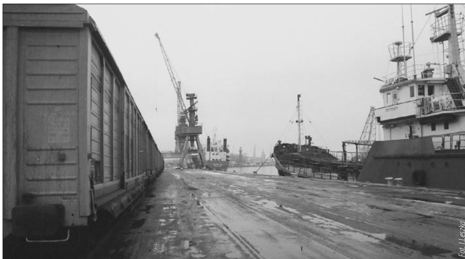
Na nabrzeżach portowych w pierwszych dniach wiosny można się spotkać z uciążliwościami po odchodzącej zimie.