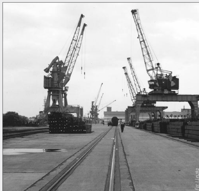
W PG Eksploatacja - plac składowy na Nabrzeżu Oliwskim.