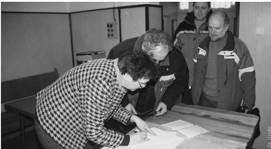
Aby otrzymać kartę do głosowania trzeba podpisać się na liście obecności...