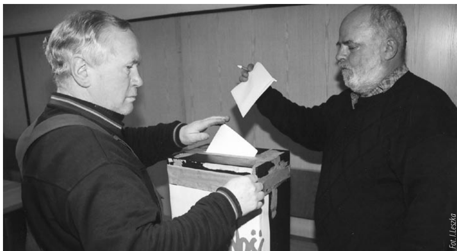
... i po dokonaniu wyboru wrzucić kartę do urny.

PS. Ponadto informujemy członków związku NSZZ „S”, że Walne Zebranie Delegatów Organizacji Międzyzakładowej przy ZMPG S.A. odbędzie się 24 marca o godz. 12.00 w siedzibie budynku „Solidarności” sala „Akwen” w Gdańsku ul. Wały Piastowskie 24.