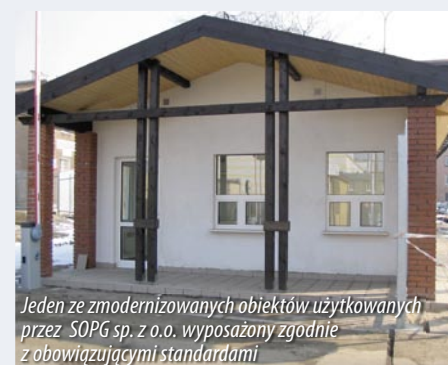
Jeden ze zmodernizowanych obiektów użytkowanych przez SOPG sp. z o.o. wyposażony zgodnie z obowiązującymi standardami

Nie ukrywamy, że osiągnięte sukcesy mają swoje podstawy; wysoka świadomość zawodowa wszystkich pracowników firmy, potwierdzone certyfikaty ISO i AQAP, stałe podnoszenie kwalifikacji zawodowych i skuteczna polityka marketingowa to nasz „przepis na sukces”. Realizując zadania statutowe nie zapominamy o inwestowaniu w doskonalenie kadr, modernizację stanowisk pracy oraz szeroko pojętą kampanię promocyjno-marketingową.