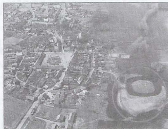
Muzeum Archeologiczne i Etykograficzne w Łodzi

„BADANIA WYKOPALISKOWE, PRZEWODZONE W LATACH 1992-1994 W OBRĘBIE PÓŹNOSREDNIOWIECZNEJ I NOWOŻYTNEJ REZYDENCJI OBRONNEJ RODU DOLIWÓW W NOWYM MIEŚCIE NAD WARTĄ, DAŁY BEZPOŚREDNI ASUMPT PODJĘCIA TEMATU TEGO OPRACOWANIA. ...” (ZE WSTĘPU) (CENA 25,00 ZŁ)