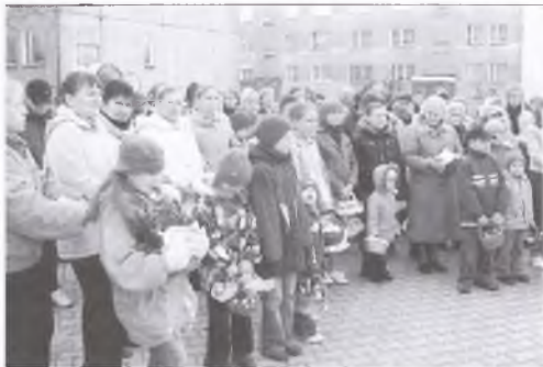
Wielki Piątek - Adoracja Grobu Pańskiego