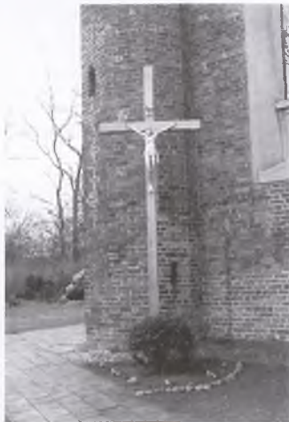
Nowy krzyż przy kościele parafialnym