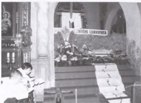
Wielka Sobota - oczekiwanie na święcenie pokarmów w Kłece