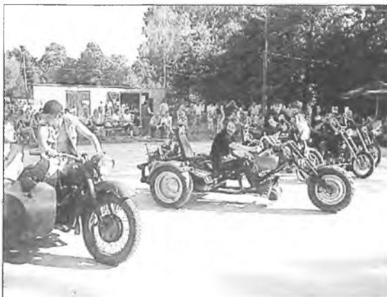
Jedną z największych atrakcji były piękne motocykle