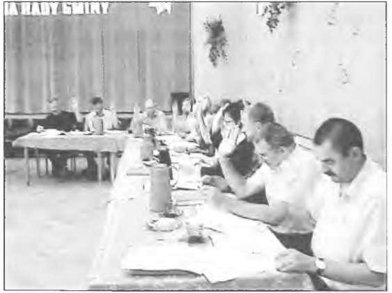
Większość uchwał przyjęto jednogłośnie