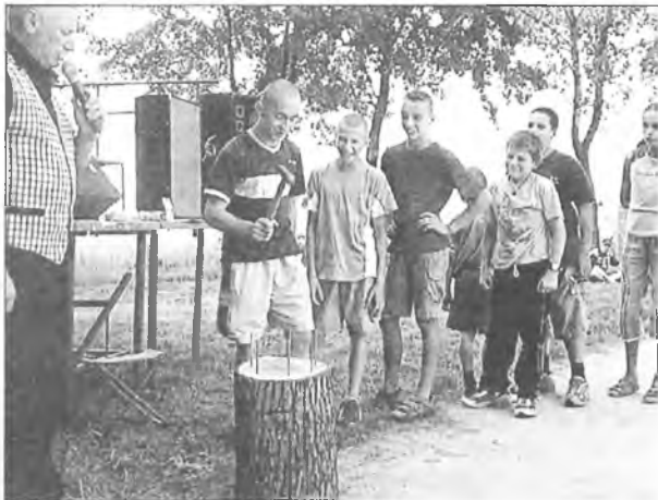
Konkurs wbijania gwoździ cieszył się sporym powodzeniem

Dzień później, w niedzielę, festyn odbył się przy sali wiejskiej w Chromcu. Organizatorzy zapewnili nie tylko wiele atrakcji, ale także słoneczną pogodę. Na scenie