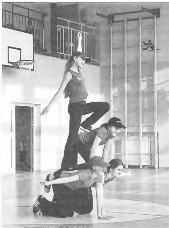
Dziewczyny dały pokaz swoich umiejętności akrobatycznych