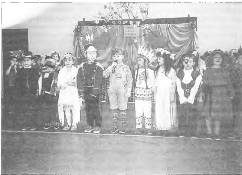
Rodzice specjalnie na tę okazję przygotowali pięknie wyglądające stroje