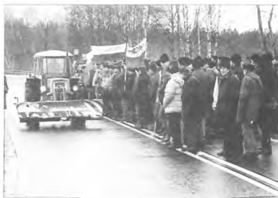
Na drodze nie panował duży ruch, gdyż policjanci kierowali większość samochodów na objazdy

pojawiali się lokalni politycy, wójtowie, wicestarosta, a także posłowie Kalemba i Tomczak. Rolnicy byli z wizytą u wojewody. Efektów protestów nadal nie widać. „Najgorsze jest to, że rozmowy z politykami