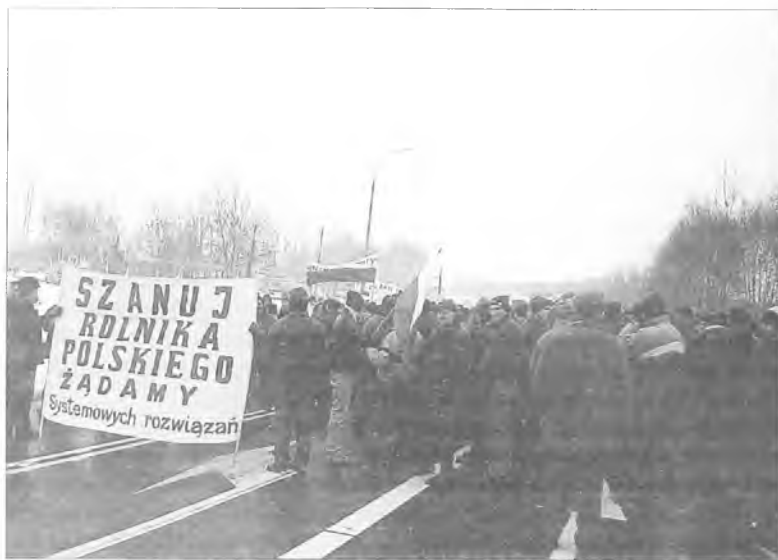
Na blokadzie pojawiło się wiele transparentów

dy przyjeżdża coraz mniej wozów policyjnych. Zmniejsza się także zainteresowanie mediów, o blokujących mówi się coraz mniej. Jednak wszyscy potwierdzają, że protestować mogą nawet do końca wiosny.