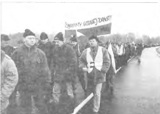
Protestujący przeszli pieszo do Kłęki

Przez cały czas samochody są przepuszczane, na miejsce blokady przyjeżdża coraz mniej wozów policyjnych. Zmniejsza się także zainteresowanie mediów, o blokujących mówi się coraz mniej. Jednak wszyscy potwierdzają, że protestować mogą nawet do końca wiosny.