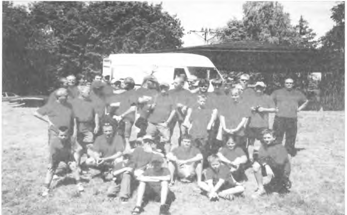
Przed wadowaniem kajaków na rzece Łupawie

i poprzewracane drzewa, kamieniste bystrza i szypoty to raj dla doświadczonych wodniaków, dostarczający wielu niezapomnianych wrażeń, pozostających w pamięci na wiele lat. Przepłynięcie dwóch uroczysk - Zielnik i Szczyrki – bez wywrotki czy uszkodzenia kajaka to nie lada wyczyn. Kilka załóg zaliczyło wywrotki na trudnych przeszkodach, a główną przyczyną niepowodzeń było zbyt szybkie napłynięcie bez starannego rozeznania. Mechanizm przewrotki jest zawsze taki sam. Dopływasz do przeszkody, źle wycelowałeś dziobem, kajak ustawia się w poprzek nurtu, jest dopychany do drzewa i wartki nurt przewraca łódkę. Wtedy jak najszybciej musisz opuścić sprzęt pływający i ratować to, co miałeś w kajaku. Następne odcinki splywu na Łupawie są już trochę łatwiejsze, ale także tylko dla doświad-