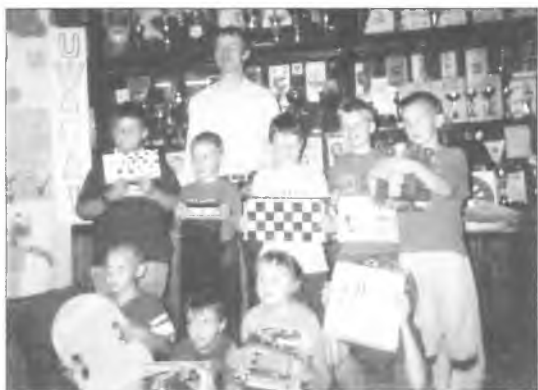
Młodzi szachiści prezentują zdobyte nagrody