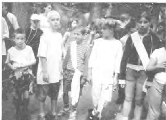
Po wyborach Miss i Mistera