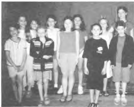
Jak widać, wszyscy w dobrych humorach...