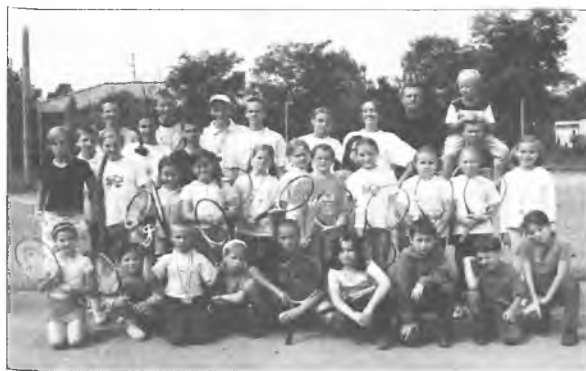
Uczestnicy zajęć z tenisa ziemnego