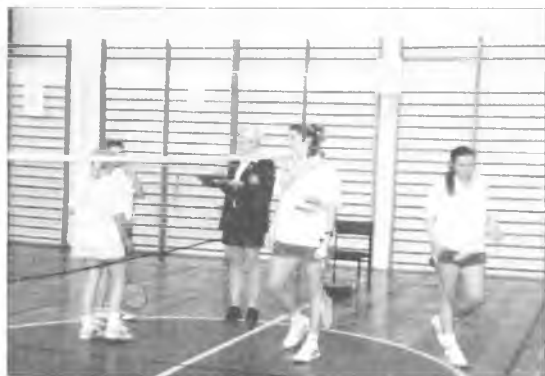
Po zwycięskim meczu

Uwaga! Dzieci z klas 3 i 4 Szkół Podstawowych zapraszamy na treningi we wtorki i czwartki w godz. 18.15 do 19.15 do sali Szkoły Podstawowej nr 1.