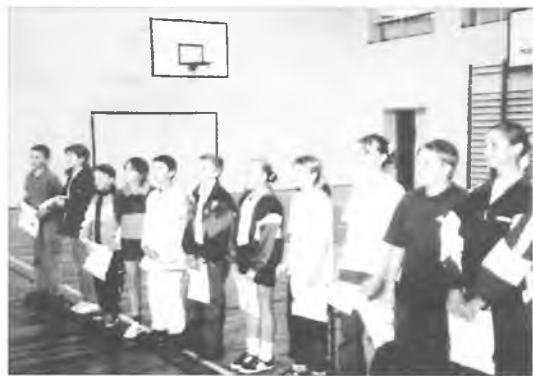
Zawodnicy uczniowskiego klubu otrzymują pamiątkowe koszulki