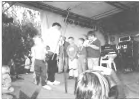
Szachy były obecne na "Dniach Puszczykowa"