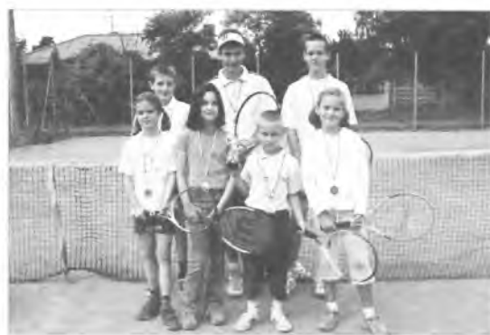
Oni byli najlepsi...