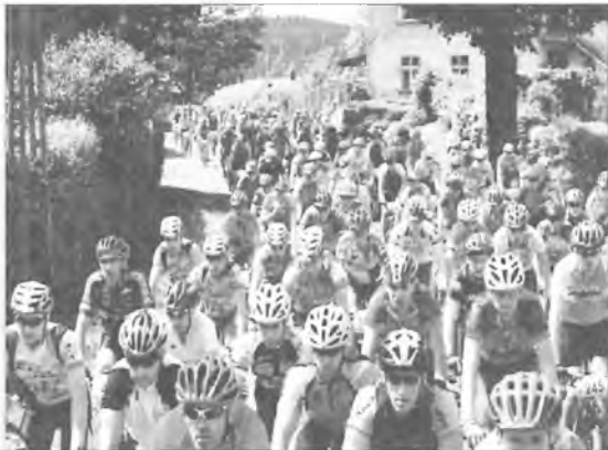
Peleton po starcie w Przesiecu