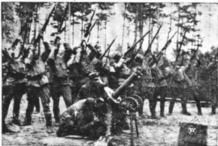
Legioniści z pierwszego pułku ulanów na pozycji pod Optową. (r. 1916).