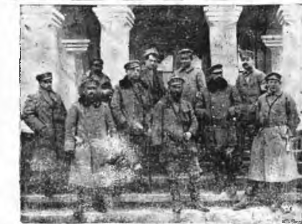
Komendant Józef Piłsudski przed „kasynem” cichociemskim 5go pułku piechoty legionowej pod Kostniuchówką (r. 1916).

Jednocześnie przyjazd do Europy dwóch specjalistów od wyborów prezydenckich daje do myślenia kołom politycznym, iż przyszłe wybory prezydenta Stanów będą się odbywały na płaszczyźnie polityki międzynarodowej.