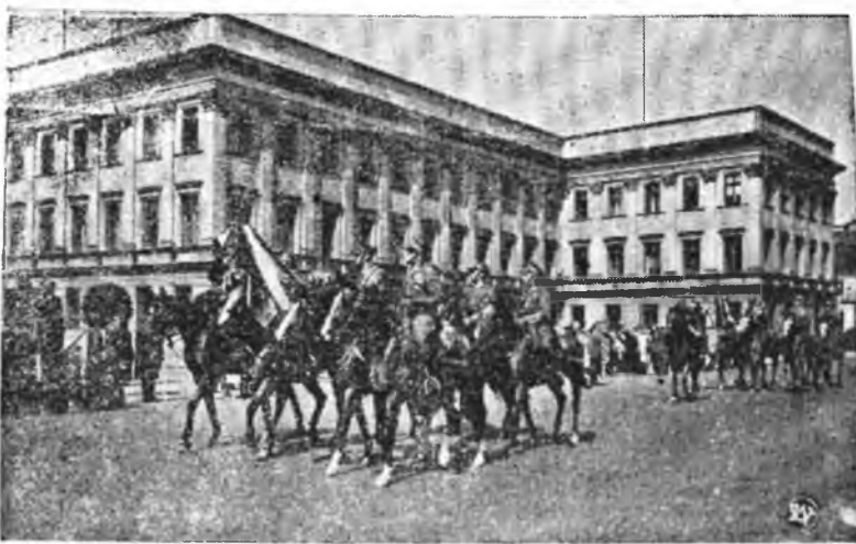
SZWOLEŻEROWIE W DEFILADZIE PRZED NACZELNYM WODZEM.

Zarząd P.C.K. Oddział Krotoszyn potwierdza niniejszym odbiór list składkowych wysłanych do gromad z okazji Tęgodnia P.C.K. Wydziały: gromada Smoszew 3,85 zł, gromada Gorzypa 4,60 zł,