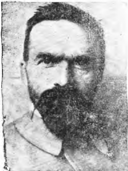
Komendant Józef Piłsudski rok 1913/14.

poprzez Rokitnę i Polską Górę, poprzez martyrologię Szczypiora i Beniaminowa Marmaros Sziget i Werlu — stworzył zastępy, którymi od listopada 1918, paż-