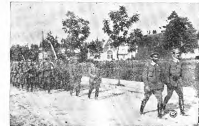
Pierwsza kmp. szkieletu, która na rozkaz Józefa Piłsudskiego wymaszerowała pod dowództwem Tad. Kasprzyckiego w dniu 6 sierpnia 1914 r. z Oleandrów w Krakowie ku granicy rosyjskiej

— „Gdy wyprowadzał was — mówił w drugą rocznicę wymarszu Pierwszej Kadrowej Józef Piłsudski do swych żołnierzy — z murów nieulnego w wa-