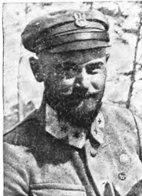
pplk. Edward Smigły-Rydz (r. 1913)

dziennika 1920 broniliśmy granic wyzwolonej Polski. I ten „inny typ człowieka” dziś również, gdy na firmamencie europejskim kłębią się chmury, grożące nawalnicą wojenną, staje znów do apelu Naczelnego Wodza z niezłomną wolą obrony każdej piędzi ziemi polskiej.